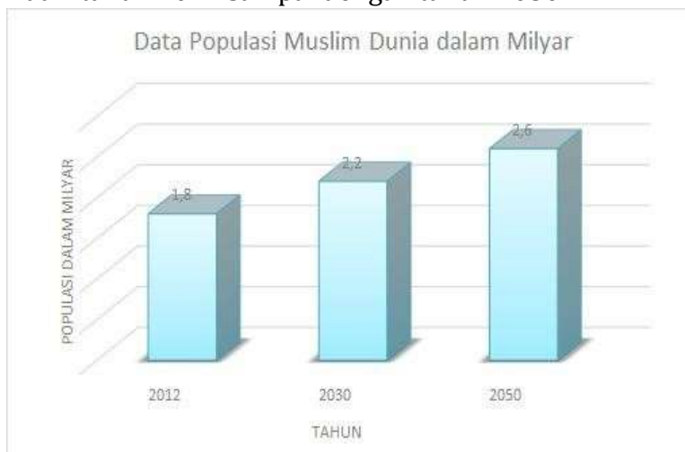
Gambar 1. Tingkat Pertumbuhan Populasi Muslim

Pertumbuhan populasi muslim juga memberikan pengaruh signifikan terhadap pertumbuhan permintaan akan produk-produk halal. Secara global populasi muslim diperkirakan tumbuh sekitar 3% pertahun. Total populasi muslim saat ini diperkirakan mencapai 23% dari populasi penduduk global atau sekitar 1.8 miliar jiwa. Tren tersebut terus meningkat, dimana pertumbuhan populasi muslim diperkirakan akan mencapai 2.2 miliar pada tahun 2030. Gambar 1 berikut menunjukkan perkiraan Tingkat Pertumbuhan Populasi Muslim dari tahun 2012 sampai dengan tahun 2050.