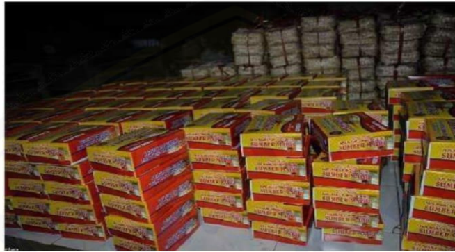
Gambar 1. Hasil akhir home industry tape singkong.

pengabdian yakni memberikan pembelajaran yang seharusnya lakukan untuk manajemen usaha tape singkong yang bersifat rumahan, dengan demikian keberadaannya bisa menopang ekonomi keluarga dan sekaligus ikut menciptakan kesempatan kerja bagi masyarakat dan meningkatkan ketrampilan dalam proses produksi, dan pemasarannya. Berikut ini saat kegiatan pengabdian berlangsung: