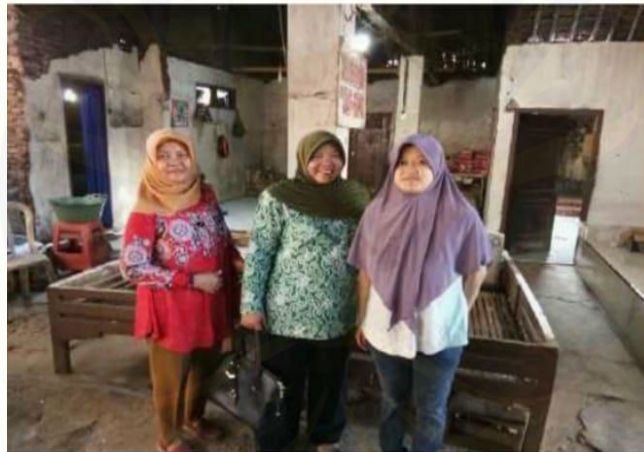
Gambar 2. Foto dibagian proses produksi dengan pemilik home industry .