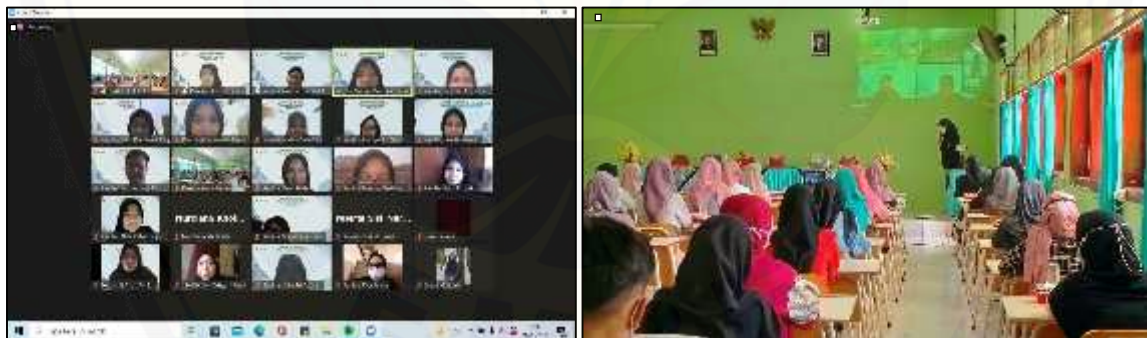
Gambar 1. Kegiatan penyuluhan " Pharmaskin " di SMA Negeri 1 Suboh Situbondo (Kegiatan daring, B. Kegiatan luring)

Kegiatan penyuluhan ini diberi tajuk " Pharmaskin " agar lebih dekat dengan peserta sasaran kegiatan. Program penyuluhan ini dilaksanakan selama satu hari selama 3 jam dengan metode hybrid yakni secara daring dan luring (Gambar 1). Acara ini merupakan salah satu praktek kegiatan proyek mata kuliah Farmasi Komunitas. Melalui tugas ini, mahasiswa diharapkan dapat memberikan gambaran komunikasi langsung terhadap masyarakat, melatih kedisiplinan serta tanggung jawab mahasiswa. Sedangkan bagi peserta dari SMA Negeri 1 Suboh, kegiatan ini diharapkan memberikan tambahan pengetahuan terkait jenis-jenis kulit wajah, cara memilih produk skincare yang sesuai dengan jenis, cara memilih skincare yang aman untuk remaja, dan cara melakukan cek produk skincare sehingga peserta dapat lebih paham cara perawatan kulit dengan benar dan aman.