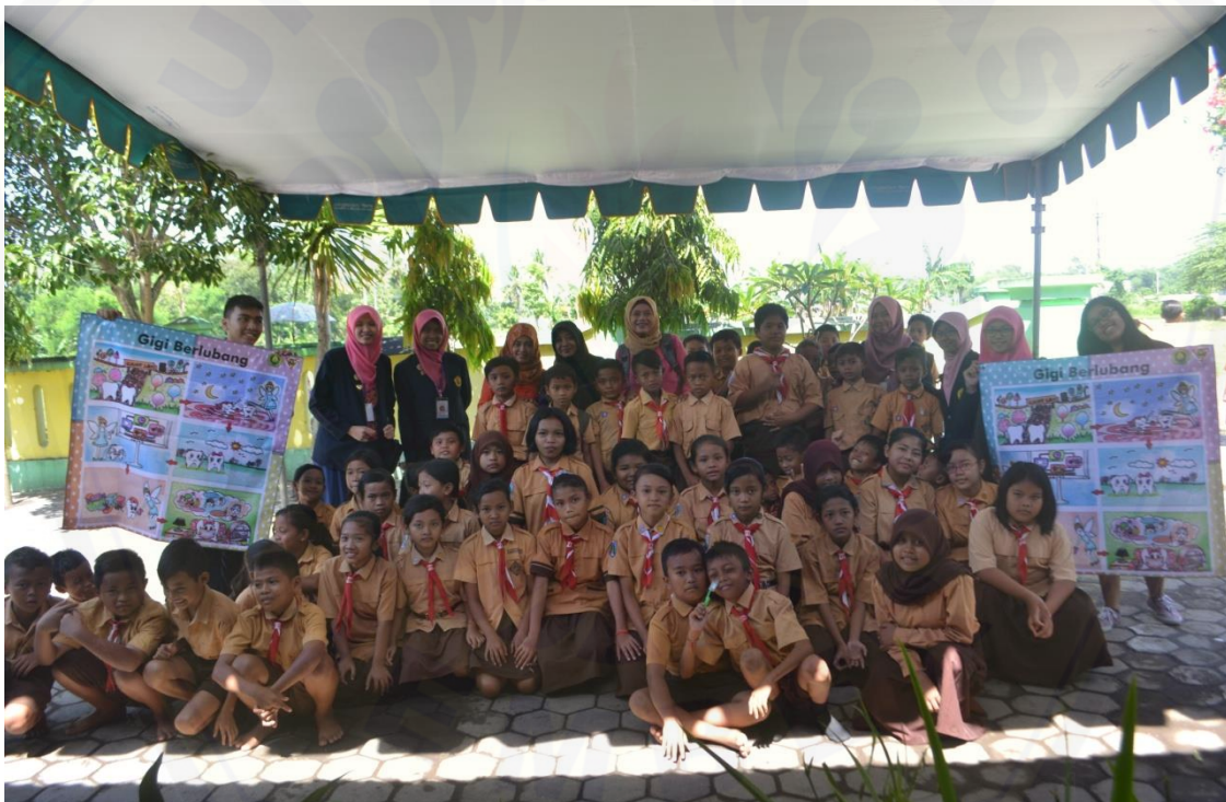
Gambar 4. Foto bersama diakhir kegiatan dan penguatan pesan kepada siswa.

Di akhir sesi, dilakukan foto bersama yang diikuti dengan semangat oleh para siswa dan guru (Gambar 4). Momen ini juga digunakan untuk menguatkan pesan kepada siswa agar mereka rajin memelihara kesehatan gigi dan mulut sebagaimana yang telah disuluhkan.