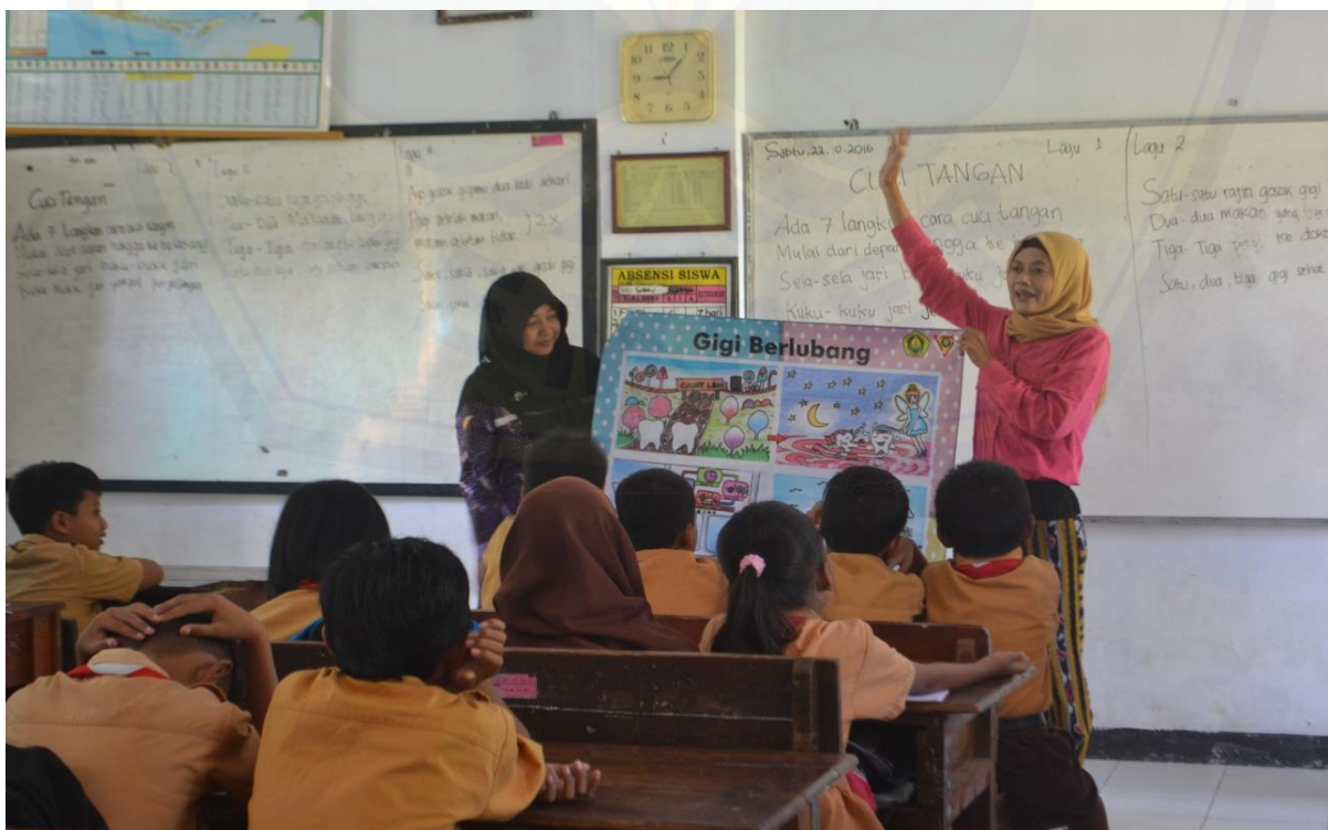
Gambar 2. Penyampaian materi oleh tim pengabdian kepada siswa

Kegiatan pengabdian yang dilakukan berupa penyuluhan kesehatan gigi dan mulut pada siswa sekolah dasar di SDN Kranjingan III di Jl. Kranjingan Sumpersari Jember berjalan dengan baik dan lancar. Dokumentasi kegiatan sebagaimana disajikan pada Gambar 2.