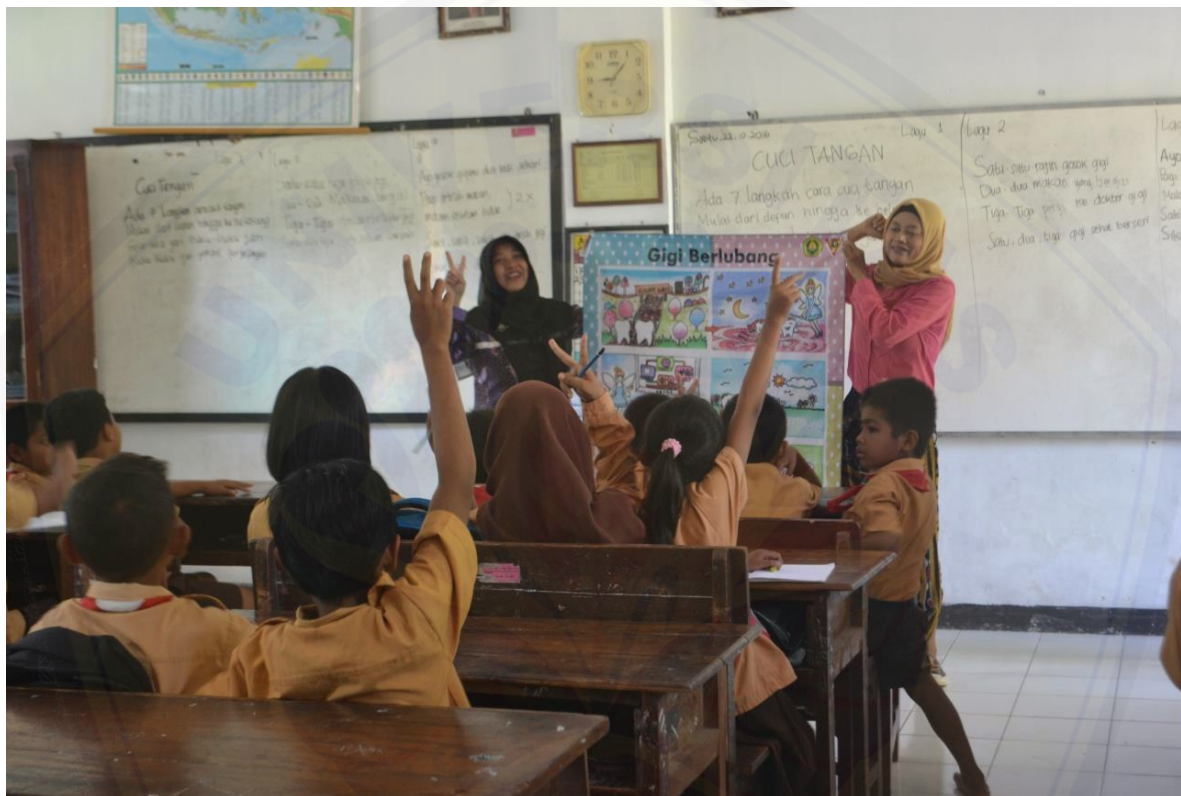
Gambar 3. Bentuk antusiasme siswa selama kegiatan

Proses penyuluhan berlangsung lancar dan mendapatkan respon yang baik dari siswa (berjumlah 76 orang, dari kelas 4 dan 5) maupun guru. Para siswa mendengarkan dengan seksama terhadap materi-materi penyuluhan, yaitu (1) gigi dan bagian-bagiannya, (2) kesehatan gigi dan mulut terutama proses terjadinya karies gigi, dan (3) kontrol plak (prosedur yang dilakukan untuk menghilangkan dan mencegah penumpukan plak serta deposit lunak dari permukaan gigi dan gingiva sekitarnya). Siswa sangat antusias karena materi tersebut selama ini belum mereka ketahui. Selain itu materi yang disampaikan menjadi sangat menarik karena didukung dengan adanya gambar dan poster untuk memudahkan para siswa mengingat. Setelah pemberian materi dan peragaan cara menggosok gigi yang benar dilakukan diskusi tanya jawab antara siswa dan tim pengabdian. Diskusi dan tanya jawab yang terjadi sangat aktif sehingga siswa merasa senang dan menambah pengetahuan mereka tentang bagaimana cara menjaga kebersihan gigi dan mulut secara benar untuk mencegah terjadinya karies gigi. Antusiasme siswa sebagaimana ditunjukkan pada Gambar 3.