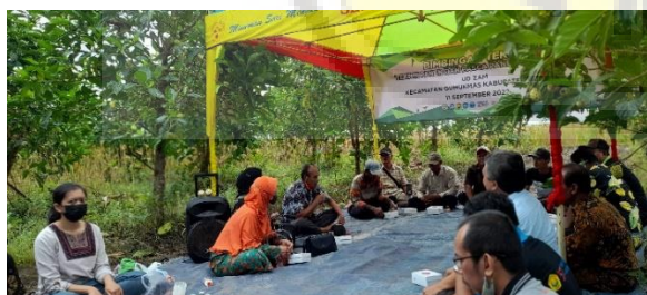
Gambar 1. Kegiatan Bimbingan Teknis Budidaya Tanaman Mengkudu dengan menerapkan Good Agricultural Practices (GAP)

Beberapa dokumentasi dari kegiatan yang telah kami laksanakan adalah sebagai berikut: