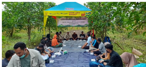
Gambar 2. Sesi Tanya Jawab Peserta Bimbingan Teknis kepada Narasumber