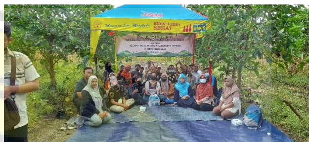
Gambar 3. Semangat para Peserta Bimbingan Teknis pada Akhir Kegiatan