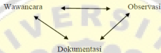
Gambar 2. Skema Metode Triangulasi

Jenis triangulasi yang digunakan merupakan triangulasi teknik data melalui wawancara mendalam terhadap informan, observasi untuk memastikan kondisi yang sebenarnya. Triangulasi ini juga melakukan dokumentasi bersama para informan setelah selesai wawancara.