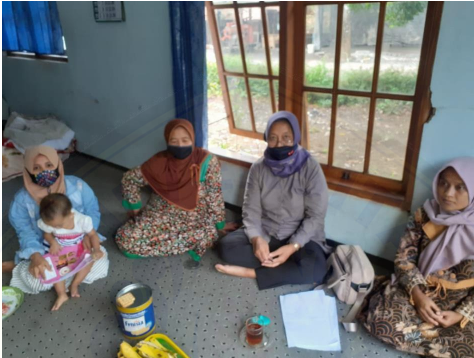
Gambar 1. Penyuluhan di rumah ibu kader Posyandu (dokumen pribadi)

gambar pelaksanaan penyuluhan pencegahan gizi buruk dan stunting melalui perubahan pola pikir.