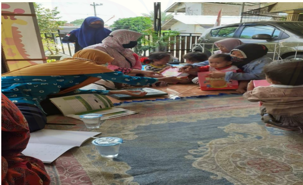
Gambar 2. Penyuluhan di rumah penimbangan Dusun Darungan Panti (dokumen pribadi).