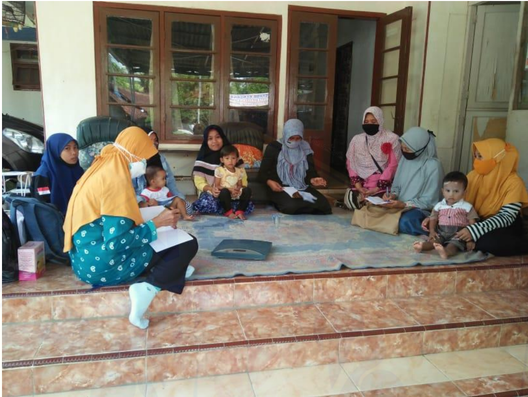
Gambar 3. Penyuluhan di rumah Kader Posyandu (dokumen pribadi)