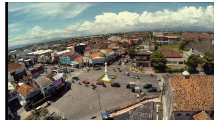
Gambar 10. Established shot pengenalan film Surga Yang Tak Dirindukan .

Penambahan cerita di stasiun kereta api juga berdasarkan pertimbangan cerita. Adegan terakhir dalam film menunjukkan Meirose pergi ke Jakarta untuk menyusul ayahnya di Jakarta sebagai wujud bahwa Meirose akan kembali lagi dalam season kedua. Lokasi stasiun kereta api tujuannya memberikan informasi pada penonton bahwa ayah Meirose berada di tempat yang masih bisa dijangkau atau tidak terlalu jauh. Jika Meirose pergi menggunakan pesawat, maka penonton akan menyimpulkan bahwa Meirose akan pergi ke tempat yang sangat jauh.