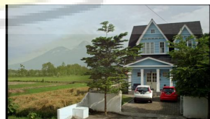
Gambar 6. Rumah Arini dan Pras tampak dari depan. (Sumber: film Surga Yang Tak Dirindukan )