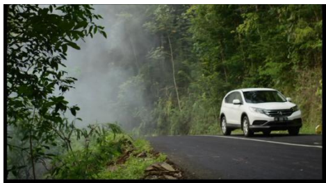
Gambar 7. Pras menepikan mobilnya untuk memeriksa apa yang terjadi dengan mobil yang mendahuluinya. (Sumber: film Surga Yang Tak Dirindukan )