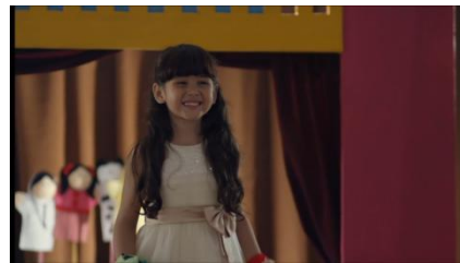
Gambar 4. Adegan Nadia menyampaikan dongengnya di lomba pentas seni. (Sumber: film Surga Yang Tak Dirindukan )

Kuntz Agus mengubah usia Nadia menjadi lima atau enam tahun karena berkaitan dengan pertengahan Arini.