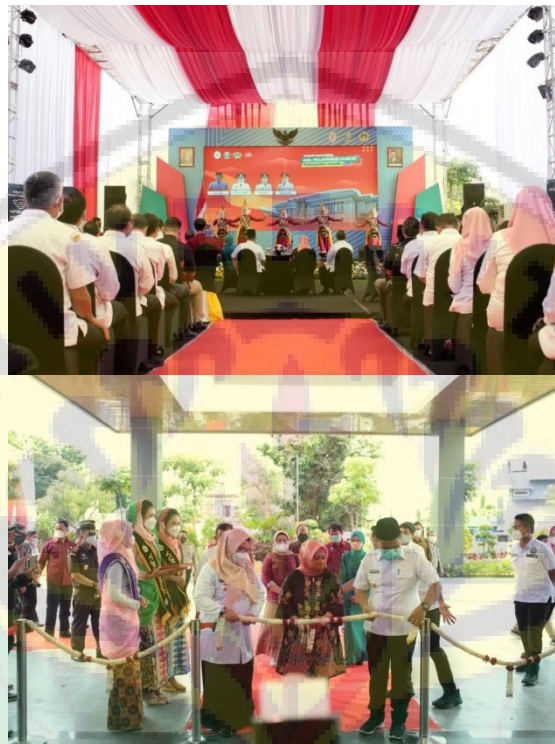
Gambar 2: Kegiatan Grand Launching Mal Pelayanan Publik sedang Berlangsung

Sepanjang acara panitia saling bekerja sama menyelesaikan tanggung jawabnya, saling menutupi kekurangan jika terdapat pekerjaan yang belum baik pengerjaannya. Tidak ada satupun panitia yang terlihat santai, semuanya menjalankan tugasnya secara serius. Hal inilah yang membuat CV. Imagine Promosindo dapat bersaing dengan event organizer yang lain. Berkat sikap tanggap, disiplin dan detail penyelenggaraan setiap event mampu berjalan dengan sangat baik, tidak mengecewakan konsumen.