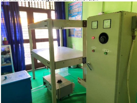
Gambar 1. Current Transformer

Penelitian ini menggunakan jenis penelitian eksperimen laboratorium dengan cara membandingkan antara dua kelompok yakni kelompok kontrol dengan kelompok eksperimen. Desain yang dipergunakan dalam penelitian ini yaitu randomized subjects post test only control group design agar dapat mengetahui pengaruh dari paparan medan magnet ELF. Bahan yang digunakan dalam penelitian ini antara lain yaitu tempe yang diperoleh dari pembuat tempe di daerah Jember, dan juga aquades. Alat yang digunakan pada penelitian ini adalah sumber medan magnet (ELF) Extremely Low Frequency yang berupa CT atau ( Current Transformer ) menjadi penghasil dari medan magnet (ELF) Extremely Low Frequency , ada pula EMF tester dengan tipe Lutron EMF-827 guna untuk mengukur akbar dari adanya medan magnet, pH meter yang dipergunakan menjadi alat pengukur suatu nilai pH, neraca yang fungsinya untuk menimbang tempe terhadap masing-masing kelompok, dan beaker gelas yang berfungsi sebagai wadah larutan untuk digunakan kalibrasi.