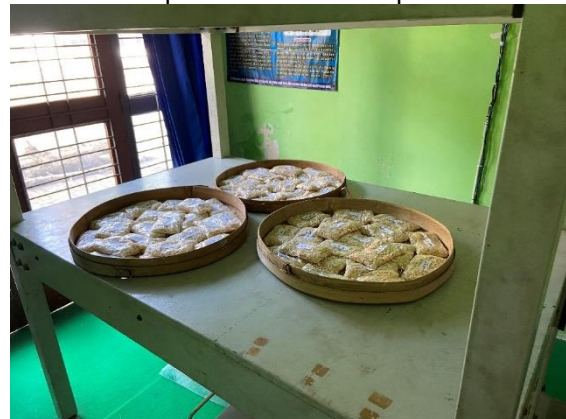
Gambar 2. Proses Pemaparan Tempe Menggunakan Medan Magnet ELF

penelitian ini pertama-tama yakni menyiapkan 145 tempe yang telah diragi, lalu membagi tempe tersebut menjadi dua kelompok ialah kelompok eksperimen dan kelompok kontrol. Kelompok kontrol yang berjumlah 25 buah tempe, sedangkan kelompok eksperimen yang berjumlah 120 buah tempe. Untuk kelompok eksperimen terbagi menjadi 2 yakni kelompok I dipaparan medan magnet ELF 200 \mu\text{T} , dan kelompok II dipaparan medan magnet ELF 300 \mu\text{T} , terhadap masing-masing dari kelompok berisi 60 buah tempe. Lalu memberikan suatu perlakuan dengan memapari tempe tersebut dengan medan magnet ELF untuk kelompok eksperimen selama 30 menit, 60 menit, dan 90 menit. Pengukuran pH dilakukan pada jam ke-0 (sebelum dipapar medan magnet ELF), jam ke-12, jam ke-24, jam ke-36, jam ke-48 setelah dipapar medan magnet ELF. Pada tahapan selanjutnya melakukan analisa data, teknik yang dipergunakan didalam suatu analisa data penelitian ini yaitu dengan menggunakan Microsoft Excel yang digunakan untuk membuat suatu grafik ada tidaknya pengaruh antara kelompok kontrol dan eksperimen.