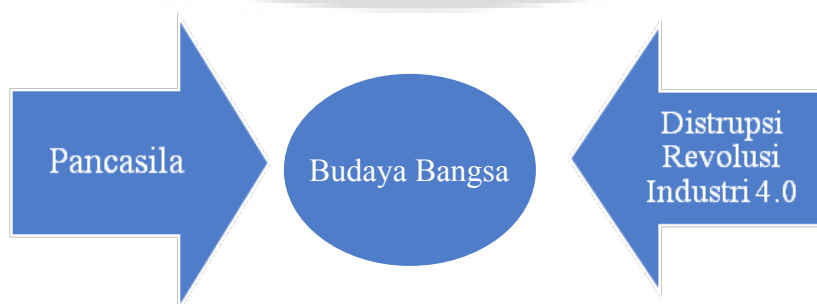
Gambar 1 Kolerasi Pancasila Dan Distrupsi Revolusi Industri 4.0 Terhadap Budaya Bangsa

Pancasila dan UUD 1945 harus diwujudkan dalam segala aspek kehidupan secara terpadu, utuh, dan menyeluruh dengan berpedoman pada wawasan nusantara, sehingga dapat digunakan sebagai sarana mewujudkan ketahanan nasional. Jiwa nasionalisme yang berdasar pada ideologi