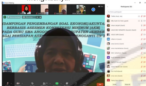
Gambar 1. Pemateri menyampaikan materi