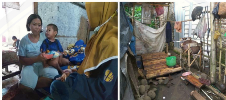
Gambar 1. Keluarga yang memiliki Balita Stunting bersama ketua Tim Pengusul dan Kondisi jamban serta sarana air bersih yang minim

Sebelum melakukan kegiatan pendidikan kesehatan, tim melakukan survey pendahuluan dengan melakukan wawancara dengan perangkat desa setempat. Dari hasil wawancara dan kunjungan ke mitra yaitu Kepala Desa Sumberwringin yang dikuatkan oleh hasil wawancara dengan Bidan Desa Sumberwringin menyebutkan bahwa kasus stunting yang ditemukan di wilayah kerjanya bersal dari keluarga miskin yang sangat minim dalam akses sanitasi yang memadai. Yaitu tidak memiliki akses sarana air bersih dan tidak memiliki jamban di rumah. Hal ini seperti hasil observasi tim pada saat melakukan kunjungan ke lokasi tempat tinggal mitra. Berikut ini dokumentasi kondisi sanitasi keluarga yang memiliki anak dalam kategori stunting :