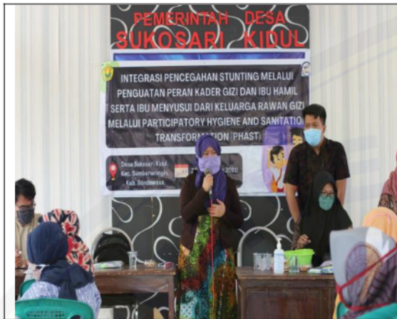
Gambar 3. Suasana pemberian Materi 1

permasalahan terkait Pencegahan stunting pada balita di 1000 HPK, serta diharapkan dapat : (1) Meningkatnya jumlah kader Posyandu yang memiliki ketrampilan dalam mencegah stunting berbasis perubahan Hiegene personal dan Sanitasi; (2) Meningkatnya rasa percaya diri kader posyandu sebagai penyuluh Pencegahan Stunting berbasis perubahan Hiegene personal dan Sanitasi; (3) Meningkatnya ketrampilan Kader posyandu, Bumil dan Busui dari keluarga rawan gizi dengan balita stunting memiliki keterampilan untuk mengolah makanan yang sesuai standar Hiegene personal dan Sanitasi sebagai upaya pencegahan stunting ; (4) Meningkatnya ketrampilan Kader gizi, bumil dan busui dari keluarga dengan balita stunting mendapatkan wawasan dan teknologi tepat guna untuk menyiapkan menu sehat melalui pemenuhan kebutuhan nutrisi ibu dan bayi yang sesuai syarat Hiegene personal dan sanitasi makanan. Berikut ini adalah dokumentasi selama kegiatan :