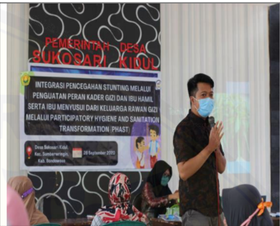
Gambar 4. Suasana pemberian Materi 2

Hasil analisis Wilcoxon menunjukkan bahwa terdapat perbedaan yang bermakna untuk tingkat pengetahuan pada seluruh peserta sebelum dan setelah diberikan materi terkait stunting dan kesehatan lingkungan dengan rata-rata peningkatan yaitu 30 poin. Setelah dilakukan stratifikasi pada kelompok peserta, hasil analisis menunjukkan bahwa kelompok ibu hamil dan kelompok ibu balita memiliki perbedaan yang bermakna pada tingkat pengetahuan sebelum dan setelah diberikan materi. Hasil analisis dapat dilihat secara lengkap pada Tabel 2.