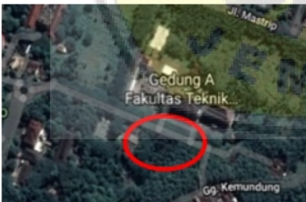
Gambar 1. Lokasi Penelitian Gedung IsDB Engineering Biotechnology

Penelitian ini dilakukan pada Gedung IsDB Project Engineering Biotechnology . Gedung tersebut berada di Universitas Jember, Jln. Kalimantan No.37 Kabupaten Jember, tepatnya di area Fakultas Teknik