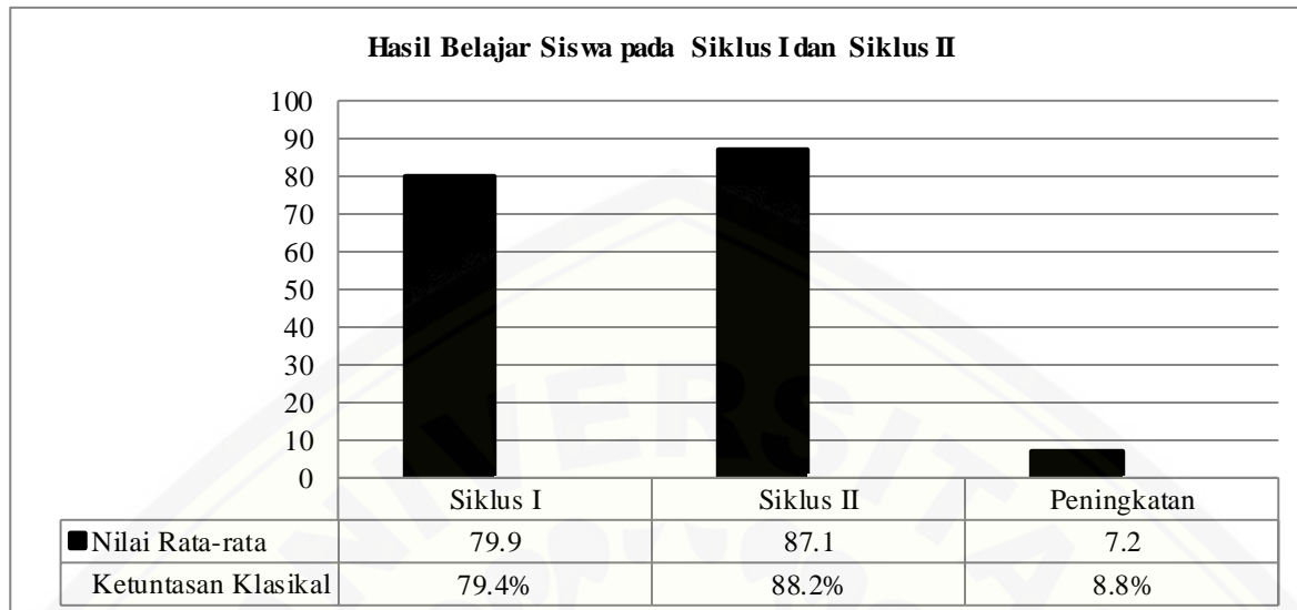
Gambar 1 Peningkatan hasil belajar siswa dari siklus I ke siklus II

Pada tabel di atas dapat dilihat bahwa terjadi peningkatan pada hasil belajar siswa. Peningkatan sebesar 7,2 nilai rata-rata siswa dari 79,9 menjadi 87,1. Sedangkan peningkatan ketuntasan klasikal mencapai 8,8% dari 79,4% menjadi 88,2%. Hal tersebut dapat dilihat pada gambar berikut ini :