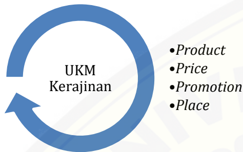
Gambar 1. Hasil FGD Cluster Kerajinan

Analisis telah dilakukan pada beberapa UKM kerajinan di Kabupaten Jember dengan mempertimbangkan Product, Price, Promotion dan Place .