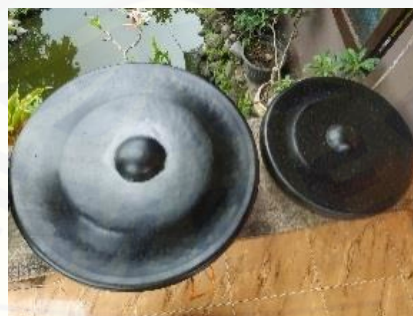
Gambar 4. Gong

Terdapat dua gong Banyuwangi yang terbuat dari besi yang dibentuk menyerupai kerucut terpancung dan setengah bola ditengahnya. Pembuatan gong tidak dapat dibuat secara bebas karena akan mempengaruhi kekhasannya. Ukuran kedua gong berbeda yang pertama berdiameter atas 75 cm, diameter bawah 60 cm, tinggi 19 cm dan diameter setengah bola 15 cm gong pertama ini bernada la