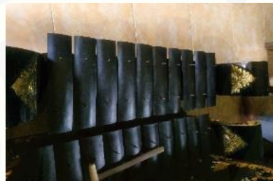
Gambar 2. Saron

Saron Banyuwangi berbeda dengan saron yang ada di daerah lain. Saron Banyuwangi ini menggunakan laras slendro Banyuwangi dengan bilah besi sebanyak sepuluh. Saron Banyuwangi memiliki dua oktaf dengan nada mi, sol la, do, re. Ukuran bilah saron yang terbuat dari yaitu panjang bilah besi pertama 30,8 cm dan bilah besi kedua 30,1 cm, bilah besi ketiga 29,4 cm, bilah besi ke empat 28,7 cm, bilah besi ke lima 28 cm, bilah besi ke enam 27,3 cm, bilah besi ke tujuh 26,6 cm, bilah besi ke delapan 25,9 cm, bilah besi ke sembilan 25,2 cm, bilah besi ke sepuluh 24,5 cm. berdasarkan observasi ukuran dari setiap bilah saron terdapat pola barisan aritmetika dimana ukuran-ukuran setiap bilah terdapat selisih 0,7. Ukuran saron tidak dapat dibuat secara bebas karena ukuran saron mempengaruhi nada, semakin panjang bilah nada akan semakin rendah dan beresonansi panjang dan sebaliknya semakin pendek bilah nada akan semakin tinggi dan beresonansi pendek.