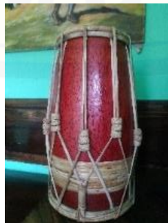
Gambar 1. Kendang