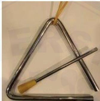
Gambar 6. Kluncing

Kluncing terbuat dari besi. Sumber suara yang dihasilkan oleh kluncing berasal dari getaran kluncing yang dipukul. Bentuk kluncing adalah segitiga samakaki dengan panjang 20 cm dan alas 16 cm. Bentuk kluncing tidak dapat dibuat secara bebas karena akan mempengaruhi bentuk kekhasannya. Ukuran kluncing dapat dibuat bebas karena kluncing tidak bernada.