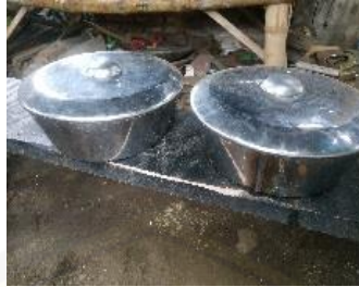
Gambar 3. Bonang

Terdapat dua Bonang Banyuwangi, yang pertama bernada la dan yang kedua bernada re. Kedua bonang memiliki bentuk dan ukuran sama yang terbuat dari besi dan dibentuk menyerupai kerucut terpancung dengan diameter atas 27 cm, diameter bawah 20 cm, tinggi 9 cm dan terdapat setengah bola ditengahnya dengan diameter 5 cm. Pembuatan bonang tidak boleh bebas, umumnya berbentuk menyerupai gong namun ukurannya lebih kecil dan ukuran bonang disesuaikan dengan nada bonang. Hasil observasi menunjukkan bahwa bonang memiliki unsur kekongruenan. Bentuk dan ukuran kedua bonang sama besar namun suara yang dihasilkan dari kedua bonang berbeda, bonang pertama bernada la atau diangka 6 diatur lebih kencang yaitu bagian atasnya lebih cembung dan bonang kedua bernada re atau diangka 2 diatur lebih kendur yaitu bagian atasnya lebih cekung.