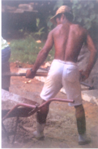
Gambar 2. Posisi Kerja Berdiri Pekerja Brazil

Posisi panggul anterversi seperti pada gambar pekerja dari Brazil menjaga tingkat dasar otot hamstring , karena itu dapat melindungi dari cedera, dan menempatkan tulang ekor langsung di dasar organ panggul sehingga memberikan dukungan tulang yang kuat dibawahnya, dan mampu berdiri dalam waktu lama tanpa harus mengganti kaki sebagai penumpu beban tubuh. Sedangkan pada pekerja di Kampung Sepatu posisi panggul retroversi memungkinkan otot hamstring untuk menyesuaikan diri dengan panjang otot yang lebih pendek dari pada biasanya dan beban tubuh tertumpu pada kaki, dan jika posisi ini berlangsung dalam waktu yang lama maka akan mengganggu peredaran darah tulang belakang [8-13].