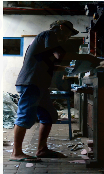
Gambar 1. Posisi Berdiri Responden

Dari hasil analisa tersebut dapat dijelaskan bahwa secara umum posisi kerja berdiri atau membungkuk dalam waktu yang lama, terlebih dilakukan dengan posisi yang salah akan memicu terjadinya nyeri punggung bawah ( Low Back Pain ) sekalipun posisi kerja berdiri masih mempunyai pergerakan yang dapat meregangkan otot khususnya punggung bagian bawah. Berikut ini disajikan gambar (foto) posisi kerja yang diambil dari responden dan posisi kerja yang benar sesuai dengan teori yang sudah peneliti dapatkan (Gambar 1)