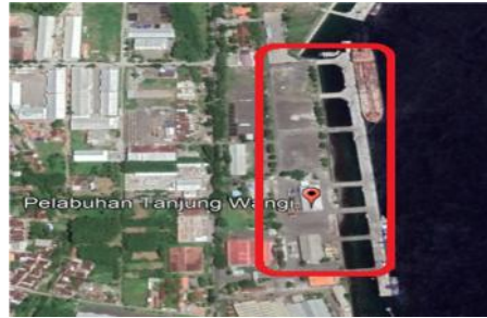
Gambar 1 Dermaga Umum Pelabuhan Tanjung Wangi

Berdasarkan tujuan studi yang ingin dicapai, adapun langkah-langkah yang dilakukan sebagai berikut :