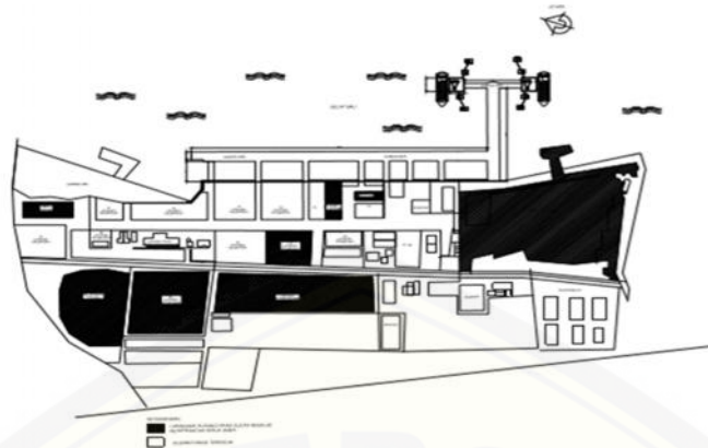
Gambar 4 Rencana Perpanjangan dermaga umum Pelabuhan Tanjung Wangi

Gambar rencana dermaga umum pelabuhan tanjung wangi pada tahun 2025 dengan tipe dermaga jetty yang dibangun dengan membentuk sudut terhadap garis dermaga sebelumnya .