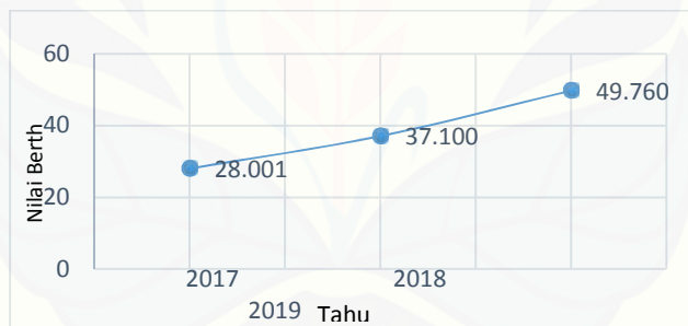
Gambar 3 Kurva Berth Time

Proyeksi nilai berth time bertujuan untuk dapat mengantisipasi kapal lama berada di dermaga. Namun nilai berth time tentunya dipengaruhi oleh jumlah kunjungan kapal, jika jumlah kunjungan kapal semakin bertambah maka resiko terjadinya berth time akan menjadi semakin besar curve berth time dapat dilihat pada gambar 3