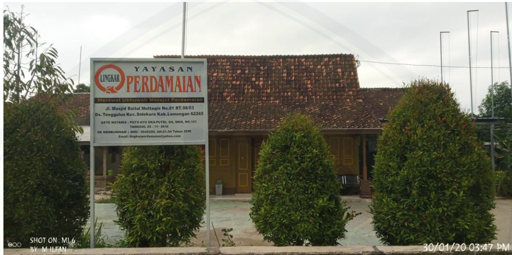
Foto rumah tempat penampungan dan bantuan untuk para NAPITER yang sudah insaf atau ingin insaf dalam usaha deradikalisasi sebelum kembali ke masyarakat