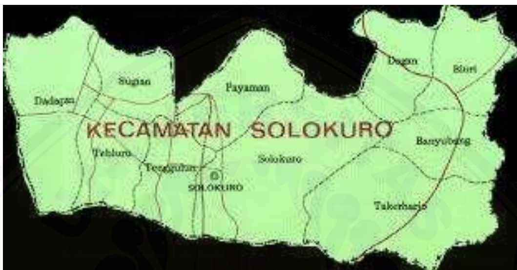
Gambar 2.1 Peta Kecamatan Solokuro.

wilayah perairan laut Kabupaten Lamongan adalah seluas 902,4 kilometer 2 , apabila dihitung 12 mil dari permukaan laut. 5 Kecamatan Solokuro merupakan salah satu dari 27 Kecamatan yang ada di Kabupaten Lamongan yang tepatnya di wilayah Pesisir Lamongan.