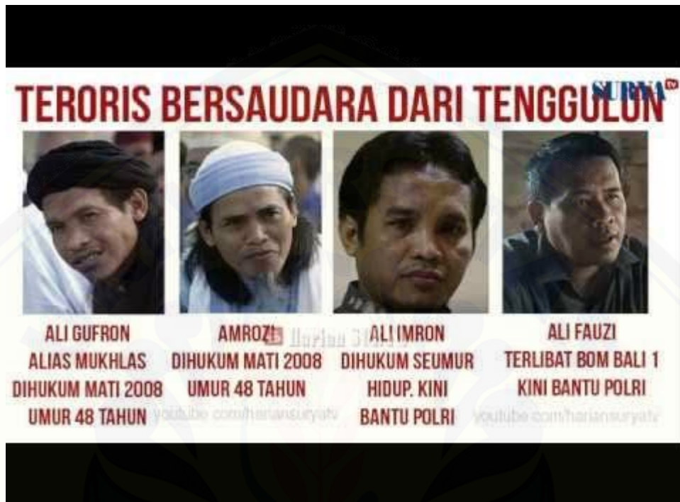
Foto mantan kombatan Jama'ah Islamiyah dari Desa Tenggulun, Kecamatan Solokuro, Kabupaten Lamongan.