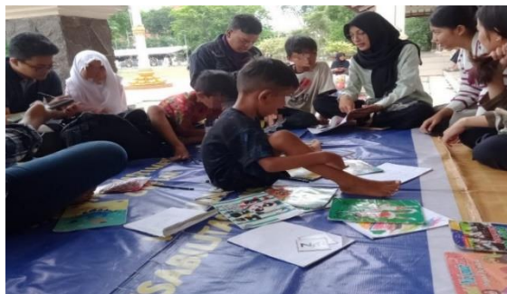
Gambar 30. Kegiatan Kelas Merdeka