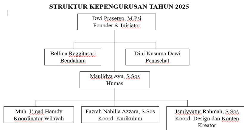
Gambar 1. Struktur Kepengurusan SSC

pengajar komunitas ini adalah anak muda yang peduli pada hak anak-anak Jalanan dan para relawan yang terlibat secara sukarela.