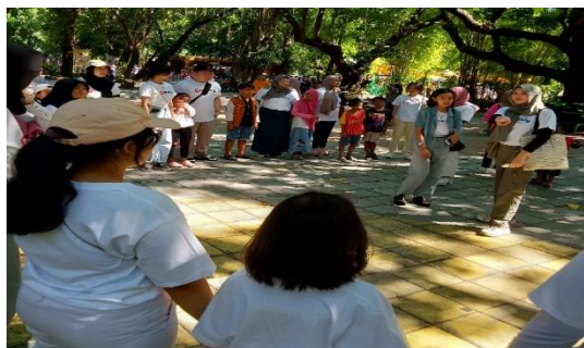
Gambar 25. Kegiatan Liburan Bersama

Sebagai seorang yang memiliki tanggung jawab di komunitas Save Street Child Sidoarjo tersebut menunjukkan penerapan nyata dari konsep kebajikan kejujuran dalam kehidupan sehari-hari sebagai bagian dari aktivis sosial. menekankan pentingnya bersikap jujur tidak hanya kepada sesama anggota, tetapi juga kepada anak-anak jalanan yang mereka dampingi. Kejujuran di sini dimaknai sebagai kesediaan untuk berkata apa adanya, termasuk dalam situasi sulit seperti ketika tidak bisa memenuhi janji.