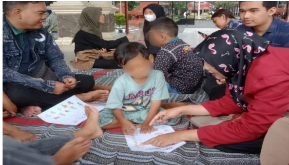
Gambar 23. Pendampingan Belajar

Berdasarkan uraian di atas sebagai anggota dan relawan komunitas Save Street Child Sidoarjo menerapkan prinsip tulus dalam menjalankan kegiatan sehingga lingkungan sekitar dapat menerima dengan baik. Menghindari kepura-puraan dan berusaha untuk menjadi diri sendiri yang sebenarnya. Dengan demikian anak-anak dapat membangun kepercayaan dan mengembangkan hubungan yang baik satu sama lain. Sehingga ketulusan kaidah kebajikan ada pada diri para anggota dan relawan sebagai bentuk untuk melaksanakan suatu kebajikan.