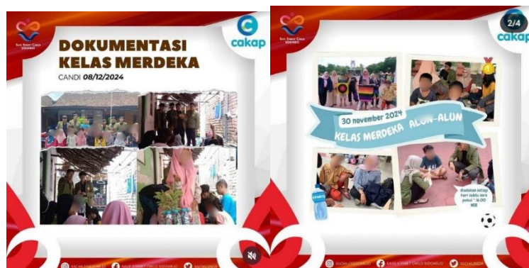
Gambar 13. Kegiatan Kolaborasi Membuat Kerajinan

Menurut Prasetyo founder Save Street Child Sidoarjo, menjelaskan kolaborasi ini biasanya mereka sering ngasih pelatihan pelatihan kayak keterampilan gitu mbak buat adik adiknya dan itu adik adik pasti seneng kalau main sambil buat kerajinan apa gitu (wawancara pada tanggal 15-01-2025). Pelaksanaan kegiatan kolaborasi menjadi sarana pelatihan bagi anak-anak jalanan untuk meningkatkan kepercayaan diri dalam berkomunikasi, mengubah pandangan negatif masyarakat, membantu anak-anak jalanan meraih kesempatan lebih baik di masa depan dan meningkatkan kemampuan adaptasi dengan masyarakat, seperti kerajinan tangan dan hal-hal keratif lainnya. Dengan kegiatan ini mereka dapat bermain sambil belajar dan mengasah keterampilan. Pelatihan ini tidak hanya membantu mengembangkan keterampilan, tetapi juga membangun kepercayaan diri dan kreativitas.