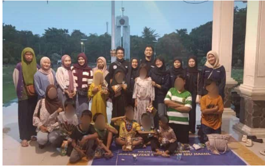
Gambar 9. Kegiatan Kelas Merdeka Kolaborasi di Alun-Alun

sosial lainnya. Kegiatan ini dilaksanakan dengan penuh keceriaan, menggabungkan pembelajaran dengan permainan dan snack, sehingga anak-anak merasa nyaman dan tidak bosan.