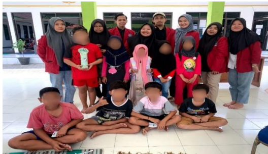
Gambar 24. Reward untuk Anak Jalanan

anak jalanan, kakaknya enak banget mbak ngajarnya, baik tutur kata ne lembut banget mbak terus habis acara pasti dikasih jajan wah itu seneng banget mbak kadang juga ada hadiah mbak jadi kita seneng kalau setiap les (wawancara tanggal 19-1-2025).