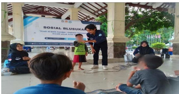
Gambar 16. Aktivis Sosial Muda Save Street Child Sidoarjo

Kegiatan di luar pekerjaan kadang kala memang dibutuhkan, rutinitas harian yang membosankan bekerja dari hari senin sampai sabtu. Oleh karena itu kegiatan mengajar anak-anak adalah kegiatan yang bermanfaat. Suatu hari menyaksikan anak-anak kecil berjualan di jalan. Sejak saat itu, memutuskan untuk bergabung dengan komunitas Save Street Child Sidoarjo dengan tujuan mendukung anak-anak dalam mendapatkan pendidikan yang mereka perlukan.