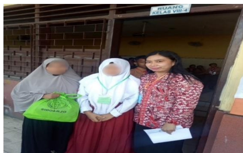
Gambar 21. Penyerahan Bantuan

Bentuk bermanfaat untuk anak-anak jalanan tidak hanya mendapatkan bantuan akademik, tetapi juga dibantu untuk mendaftar ke sekolah. Bagi mereka yang tidak mampu, akan dibantu menyediakan seragam sekolah dan kebutuhan lainnya, sehingga mereka dapat bersekolah dengan lebih nyaman dan percaya diri. Anggota dan relawan komunitas Save Street Child Sidoarjo selalu memastikan bahwa tindakan yang mereka laksanakan bermanfaat bagi masyarakat secara keseluruhan dan dapat meningkatkan kualitas hidup masyarakat serta mempromosikan nilai-nilai kebaikan antar sesama.