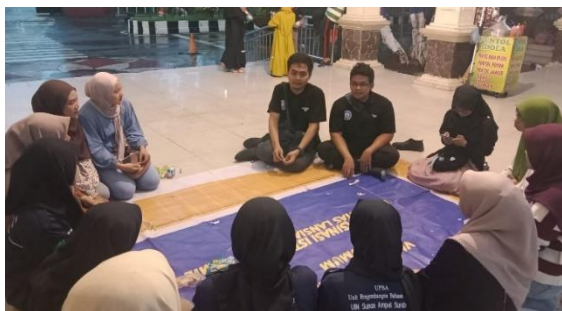
Gambar 26. Rapat Setelah Kegiatan