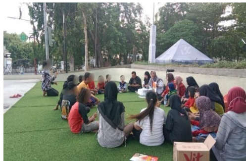
Gambar 8. Kegiatan Belajar Kelas Merdeka di Alun-Alun

Kegiatan yang diselenggarakan Save Street Child Sidoarjo dirancang agar anak jalanan dapat belajar sambil bermain, yang terpenting adalah anak-anak merasa senang dan nyaman, sehingga dapat lebih mudah menerima materi yang diberikan dan mengembangkan keterampilan. Dengan cara ini belajar menjadi lebih menyenangkan. Kegiatan kelas merdeka dilaksanakan pada hari Sabtu bertempat di Playgound Jayandaru Alun-Alun Sidoarjo. Lokasi ini dipilih dikarenakan tempat berkegiatan anak jalanan. Salah satu pendekatan yang digunakan oleh komunitas Save Street Child adalah dengan mengunjungi langsung lokasi tempat anak-anak jalanan berkumpul dan beraktivitas. Strategi ini terbukti efektif dalam membangkitkan minat belajar di kalangan anak-anak tersebut.