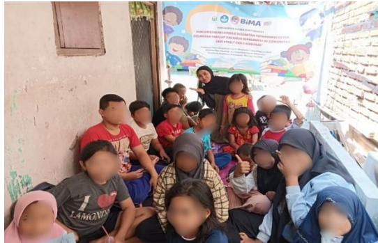
Gambar 19. Kegiatan Belajar Bersama

Proses pengambilan keputusan dan pelaksanaan kegiatan transparan sehingga semua anggota dapat memahami dan menerima keputusan bersama yang diambil. Dengan prinsip yang diterapkan ini dapat membangun kepercayaan antara anggota, masyarakat serta memperkuat hubungan sosial. Diskusi atau evaluasi bersama bertempat di basecamp , untuk mengetahui masalah atau kesulitan yang sedang dihadapi baik dari anggota maupun relawan komunitas Save Street Child Sidoarjo. Mengevaluasi dan membahas bersama-sama mencari solusi yang tepat, untuk menemukan titik tengah dan mencapai kesepakatan yang baik.