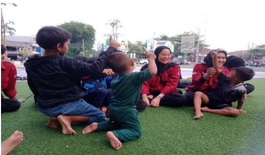
Gambar 28. Kegiatan Bermain Tebak-Tebakan

Kaidah Kebajikan diam menekankan pentingnya pengendalian diri dalam berbicara. Terlalu banyak berbicara, apalagi yang tidak bermanfaat, bisa merugikan diri sendiri dan orang lain. Dengan bersikap diam dan hanya berbicara ketika diperlukan, seseorang dapat menghindari percakapan sia-sia, gosip, atau konflik yang tidak perlu. Selain itu, diam juga membantu seseorang untuk menjadi pendengar yang baik, meningkatkan efisiensi dalam bertindak, serta menciptakan ruang untuk refleksi diri.