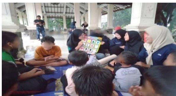
Gambar 22. Game Bersama Anak Jalanan

Konsep kesederhanaan menekankan pentingnya kesederhanaan dan kerendahan hati dalam melaksanakan kaidah kebajikan. Anak muda yaitu anggota dan relawan komunitas Save Street Child Sidoarjo harus melakukan tindakan yang sederhana dan tidak berlebihan, sehingga mereka dapat menghindari kesan yang berlebihan. Kesederhanaan tercermin dalam cara berbicara yang santun dan tidak berlebihan, serta dalam penggunaan alat-alat yang sederhana namun tetap mampu menghasilkan kegiatan yang bermanfaat dan mudah diterima oleh lingkungan sekitar. Seperti yang dijelaskan oleh Prasetyo, founder Save Street Child Sidoarjo, iya intinya kita sebagai relawan harus dapat berbaur dengan lingkungan sekitar sehingga kita dapat lebih mudah diterima dilingkungan tersebut, jadi masyarakat gak ragu sama kehadiran kita (wawancara pada tanggal 15-1-2025).