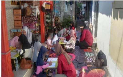
Gambar 10. Kegiatan Belajar Kelas Merdeka Desa Candi