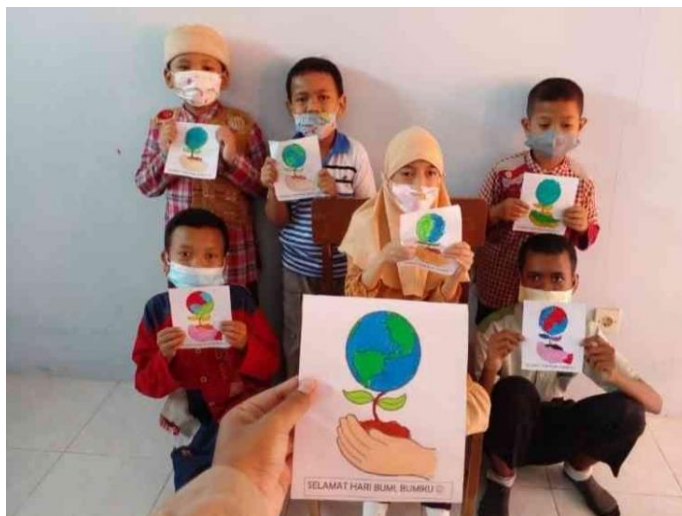
Gambar 4.3 Kegiatan Menggambar Bersama ABK