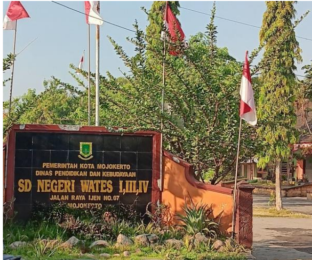
Gambar 4. 1 Tampak Depan SDN Wates I,III,IV

Gambar 4.1 di atas memperlihatkan bahwa SDN Wates 1 Kota Mojokerto satu lingkungan dengan SDN Wates 3 dan SDN Wates 4. Penelitian ini dilaksanakan secara terpusat di salah satu sekolah dasar negeri yang ada di Kecamatan Magersari, Kota Mojokerto Jawa Timur yaitu SDN Wates 1 Kota Mojokerto yang di kepalai oleh Ibu Sri Kusumaningsih, S.Pd, MM. Di SD ini terdapat siswa laki-laki sebanyak 92 anak dan siswa perempuan sebanyak 74 anak, sehingga jika ditotal terdapat 166 siswa yang bersekolah disana. SDN Wates 1 Kota Mojokerto ini merupakan salah satu SD di wilayah Mojokerto yang ditunjuk oleh pemerintah setempat untuk menerapkan sistem pendidikan inklusi terhitung sejak tahun 2013. SDN Wates 1 Kota Mojokerto dipilih untuk menerapkan sistem pendidikan inklusi karena dianggap siap dalam berbagai aspek dan pihak sekolah sendiri juga merasa siap untuk menerapkan pendidikan inklusi.