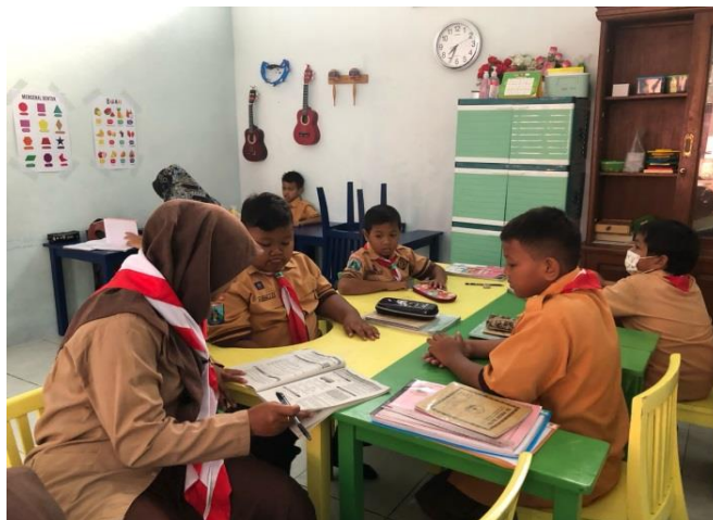
Gambar 4. 2 Suasana Kelas Inklusi

Sejak ditunjuk oleh pemerintah sebagai salah satu sekolah yang menerapkan sistem pendidikan inklusi dari tahun 2013 lalu SDN Wates 1 Kota Mojokerto ini sekarang ini telah mengalami kemajuan diberbagai aspek diantaranya seperti fasilitas sarana dan prasarana yang mulai ada kemajuan, telah memiliki guru khusus bagi peserta didik berkebutuhan khusus, terdapat kelas khusus bagi ABK, kurikulum khusus ABK dan berhasil menjalin hubungan komunikasi serta kerjasama yang baik dengan orang tua peserta didik berkebutuhan khusus yang sekarang ini tergabung dalam paguyuban wali murid inklusi.