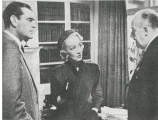
Gambar 2.3 Contoh medium shot yang sering digunakan oleh sebagian besar film teater dan televisi (Sumber: Joseph V. Mascelli, 29 November 2022)

dan sebagainya. Dengan demikian kita menjadi lebih terlibat dalam apa yang mereka bicarakan dan lakukan, tanpa berfokus pada satu karakter atau detail tertentu saja.