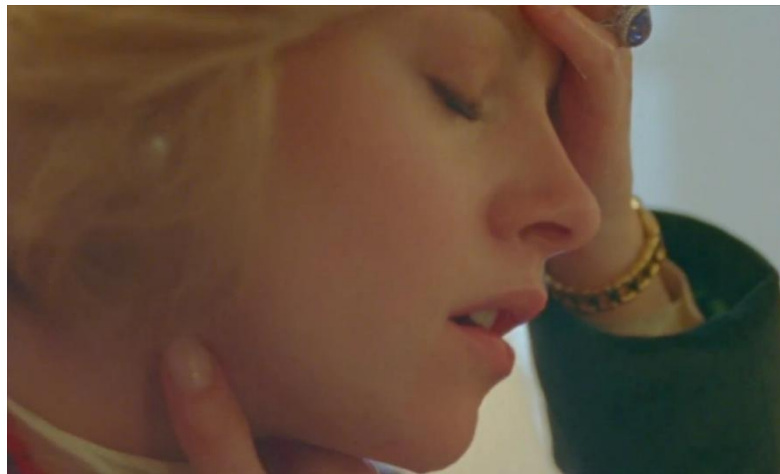
Gambar 4.2 Screen capture kesedihan Diana ketika menenangkan diri dari gangguan Bulimianya, timecode 00:18:48 – 00:18:55

Sebelum Diana menenangkan diri dari gangguan Bulimianya, Diana sedang berbincang dengan kedua anaknya (William dan Harry). Tak lama, pengawas kerajaan memberitahu Diana untuk segera bergegas ke ruang tamu karena agenda makan sandwich bersama keluarga kerajaan akan segera dimulai. Setelah pengawas menyuruhnya untuk bergegas, Diana mengalami perubahan emosi yang awalnya tenang saat berbincang dengan kedua anaknya, mendadak berubah menjadi gelisah. Diana merasa tidak nyaman dan menyuruh kedua anaknya untuk pergi terlebih dahulu ke ruang tamu. Gangguan Bulimia yang dimiliki Diana kambuh, dan membuatnya harus segera ke kamar mandi untuk memuntahkan isi perutnya. Adegan ini dimulai pada timecode 00:18:48 – 00:18:55, tepatnya setelah Diana memuntahkan seluruh isi perutnya dan masih berusaha untuk menenangkan diri.