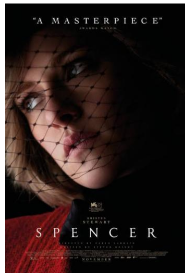
Gambar 4.1 Poster Film Spencer

Spencer merupakan film fiksi ber-genre drama biografi yang tayang perdana di Festival Film Internasional Venesia ke-78 pada tanggal 3 September