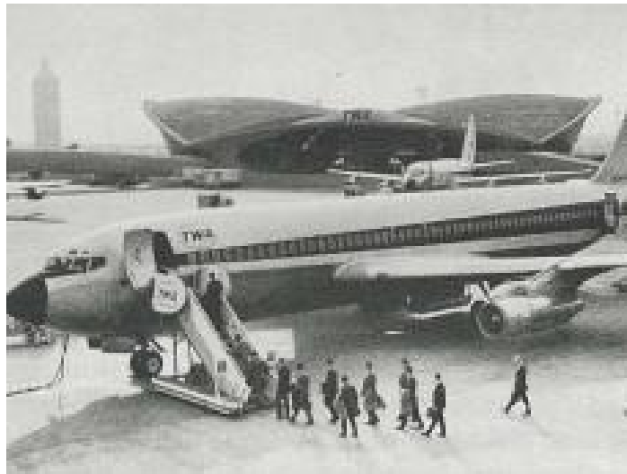
Gambar 2.2 Contoh long shot untuk menggambarkan ukuran objek pesawat jet

Long shot umumnya dibuat tidak sempit agar pemain mendapatkan ruang yang cukup untuk bergerak, dan juga untuk menunjukkan keseluruhan setting .