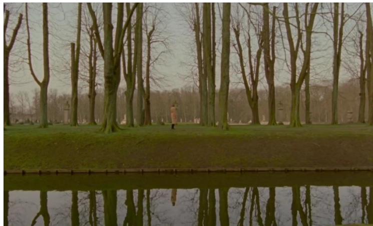
Gambar 4.4 Screen capture kesedihan Diana setelah sahabatnya dipindah tugas, timecode 01:12:53 – 01:13:22

karena ia belum bersiap untuk makan malam dan malah berjalan-jalan sendirian. Diana enggan untuk menghadiri makan malam dan menolak perintah Gregory untuk segera bersiap. Hal ini merupakan salah satu protesnya terhadap pihak kerajaan yang tanpa seizin Diana membuat Meggie, penata busananya sekaligus satu-satunya sahabat dan teman mengobrolnya di istana dipindah tugas jauh dari dirinya. Mayor Gregory yang merasa Diana sedang dalam keadaan tidak baik-baik saja mencoba memberinya beberapa masukan dan menyuruhnya untuk tetap menjalani kehidupan dengan bersikap baik-baik saja. Beberapa masukan dari Mayor Gregory malah membuat Diana semakin memikirkan dan mengasihani kehidupannya di istana, ia semakin merasa sendirian. Hal inilah yang membuat Diana kemudian berjalan sendirian menyusuri pinggir danau.