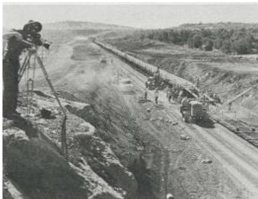
Gambar 2.9 Contoh pengambilan gambar High Angle

Pada umumnya, high angle merupakan penempatan kamera yang berada di atas mata subjek. Sebenarnya, kamera dapat ditempatkan di bawah ketinggian mata juru kamera, untuk melihat ke bawah. Hal ini juga berguna untuk melihat objek yang kecil.