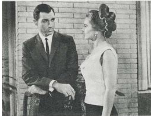
Gambar 2.8 Contoh Level Angle