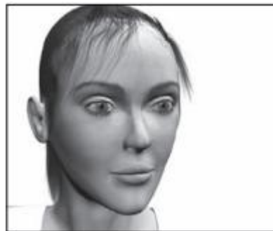
Gambar 2.6 Contoh Choker atau Bog Head Close-up