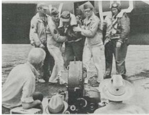
Gambar 2.10 Contoh pengambilan gambar Low Angle (Sumber: Joseph V. Mascelli, 29 November 2022)