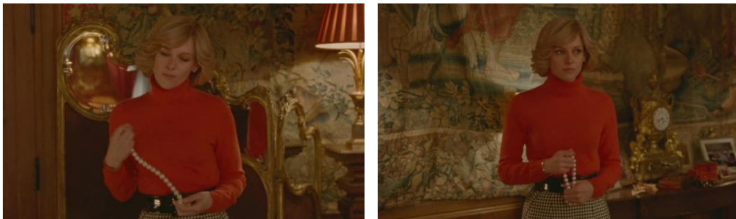
Gambar 4.3 Screen capture kesedihan Diana ketika membahas pengkhianatan suaminya, timecode 00:23:37 – 00:23:51

Adegan ini dimulai dari timecode 00:23:37 – 00:23:50. Tepatnya setelah Diana mencari dan mengambil sebuah kalung mutiara lalu mencoba memakainya. Diana terlihat sedikit ragu untuk memakai kalung tersebut, lalu secara tiba-tiba ia bertanya kepada pelayan perihal keindahan kalungnya dan menceritakan bagaimana suaminya tidak mengetahui bahwa ia telah melihat foto Camilla, simpanan suaminya, memakai kalung yang persis sama dengan miliknya. Diana juga terlihat berkali-kali menekankan bagaimana suaminya tidak menyadari bahwa Diana dapat mengetahuinya.