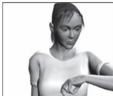
Gambar 2.4 Contoh Medium Close-up