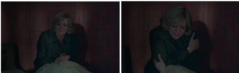
Gambar 4.5 Screen capture kesedihan Diana ketika merindukan masa kecilnya, timecode 01:27:28 – 01:27:47

kecilnya dan mulai bernostalgia di sana. Semenjak Diana memasuki rumahnya, berbagai memori akan masa lalu terus bermunculan dan membuatnya mengingat bagaimana dirinya saat kecil dan masih menyandang nama keluarga Spencer. Semakin lama ia melihat barang-barang masa kecil di rumah lamanya, semakin ia merasa bahwa dirinya sudah kembali ke rumah yang sesungguhnya. Sehingga pada adegan ini, Diana sudah tidak kuasa menahan rasa sedihnya. Berbanding terbalik ketika ia di istana, Diana tidak bisa sembarangan bersikap dan dituntut untuk selalu sempurna. Di rumah masa kecilnya, ia bisa meluapkan segala emosi yang dirasakannya. Maka dari itu, Diana mulai meringkuk di pojok ruangan kamar lamanya sembari memeluk diri sendiri dan menangis mengeluarkan segala rasa sedihnya.