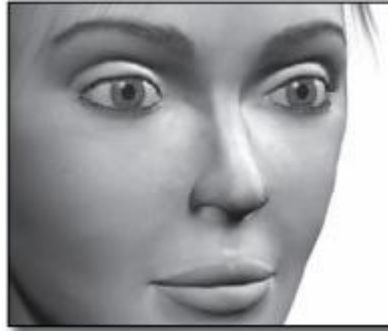
Gambar 2.7 Contoh Extreme Close-up