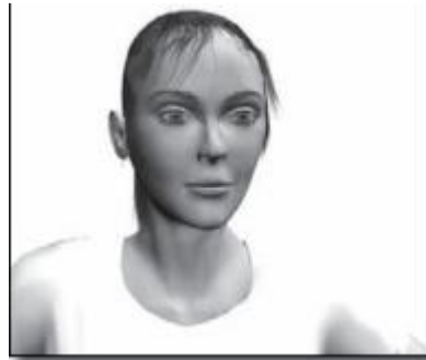
Gambar 2.5 Contoh A Head and Shoulder Close-up