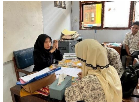
Wawancara di Kelas XI 5