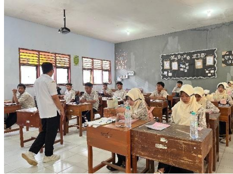
Observasi kelas XI 3