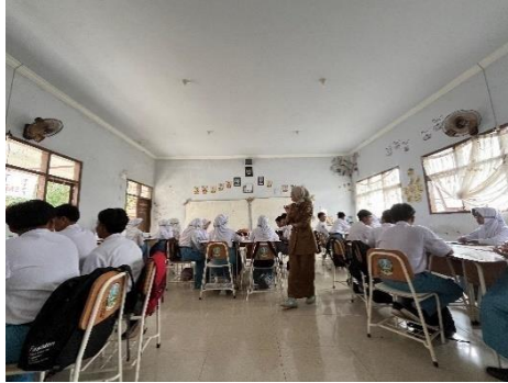
Observasi Kelas X 4