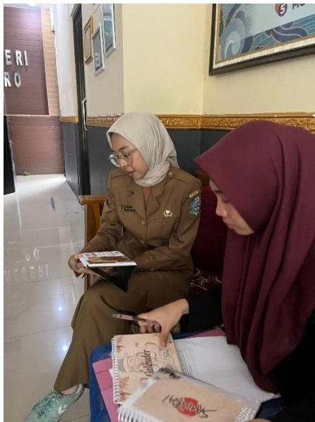
Penjelasan Projek Kelas X (Membuat Kalender)