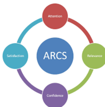
Gambar 2 2 Model ARCS

Model ARCS ( Attention, Relevance, Confidence, Satisfaction ) menekankan bahwa motivasi belajar dapat ditingkatkan melalui perhatian siswa, relevansi materi dengan kebutuhan mereka, keyakinan diri untuk berhasil, serta kepuasan atas hasil yang diperoleh Keller (2010). Motivasi belajar dapat dijelaskan melalui Model ARCS yang terdiri dari empat komponen utama, yaitu