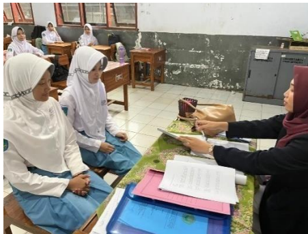
Wawancara di Kelas X 6