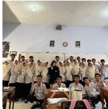
Foto Bersama Kelas XI 5