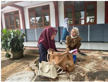
Wawancara Bersama Ibu Denok