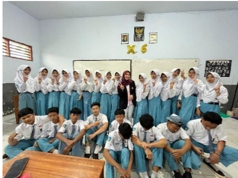
Foto Bersama Kelas X 6