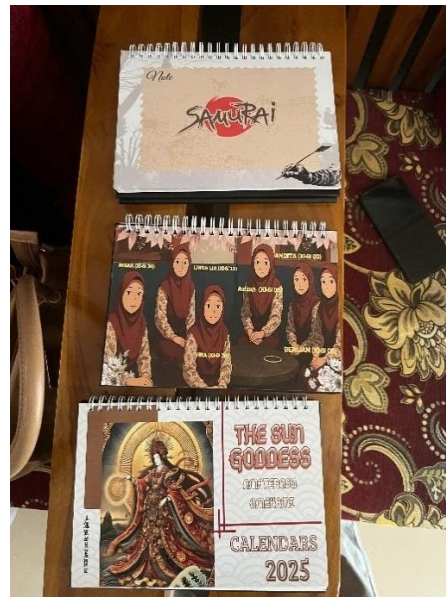
Karya Kelas X