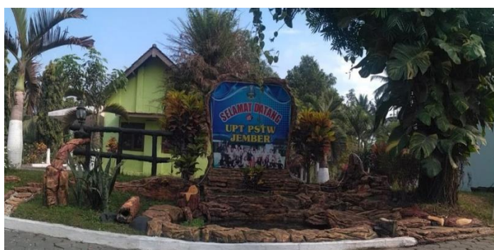
Gambar 1. 1 UPT Panti Sosial Tresna Werda Jember (Sumber : diolah oleh peneliti 2024)

peneliti tertarik dengan adanya pelayanan yang dilakukan oleh pihak lembaga, namun tidak semua pasien merasakan hal yang sama, ada yang sulit beradaptasi setelah lepas dari keluarganya karena tidak mendapat fasilitas seperti sebelumnya. Lansia mandiri yang belum dapat beradaptasi menyebabkan terganggunya keberfungsian sosial mereka. Usaha yang dilakukan oleh PSTW adalah dengan memberikan pelayanan sosial yang bertujuan untuk meningkatkan keberfungsian sosial lansia di PSTW.