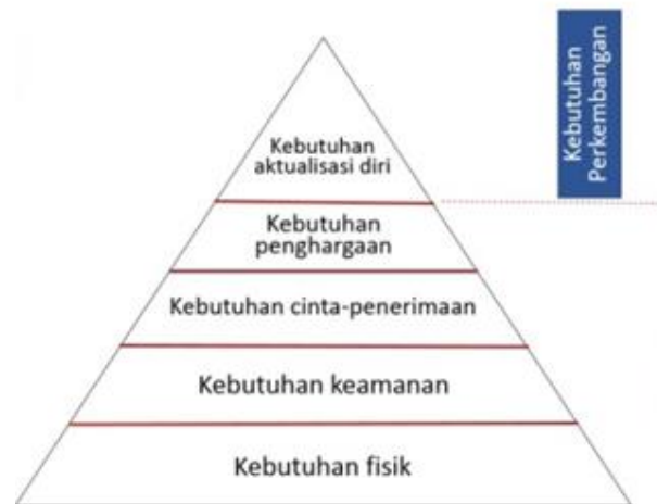
Gambar 2.1 Teori Kebutuhan Bertingkat Abraham Maslow

kebutuhan-kebutuhan tersebut. Semakin kebutuhan tinggi mampu dipuaskan, semakin individu mampu mencapai individualitas, matang, dan berjiwa sehat. Berikut kebutuhan manusia yang tersusun dengan lima tingkat kebutuhan menurut Maslow (dalam Koeswara, 1991:118) sebagai berikut: