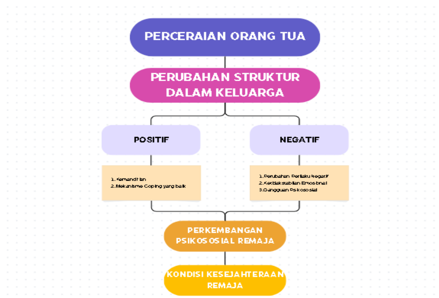
Gambar 1.1 Kerangka Berpikir

Penelitian ini bertujuan untuk menganalisis dampak perceraian orang tua terhadap gangguan psikososial remaja di SMA Labschool Bandung. Perkembangan individu dipengaruhi oleh interaksi antara aspek psikologis dan lingkungan sosialnya, sebagaimana teori psikososial Erikson. Kerangka teori ini relevan untuk menjelaskan bahwa ketidakstabilan keluarga akibat perceraian dapat menimbulkan dampak negatif terhadap perkembangan psikososial remaja dan menunjukkan pentingnya intervensi yang tepat untuk memitigasi dampak tersebut. Kerangka berpikir yang digunakan dalam penelitian ini sebagaimana tergambar dalam bagan di bawah ini: