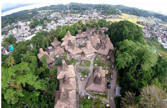
Gambar 5. Topografi Sumba Barat

Pola pemukiman masyarakat Sumba barat umumnya tidak memiliki pola tertentu sehingga posisi dan arah letak rumah tidak diatur dalam suatu ketentuan atau peraturan adat, lebih memperhatikan topografi yang ada. Akan tetapi peletakan rumah menghadap timur dan barat dihindari karena diyakini penghuni rumah akan susut, seperti tenggelamnya matahari, dan timur diyakini akan menjadi panas dan mendatangkan bahaya (Artanegara, 2018).