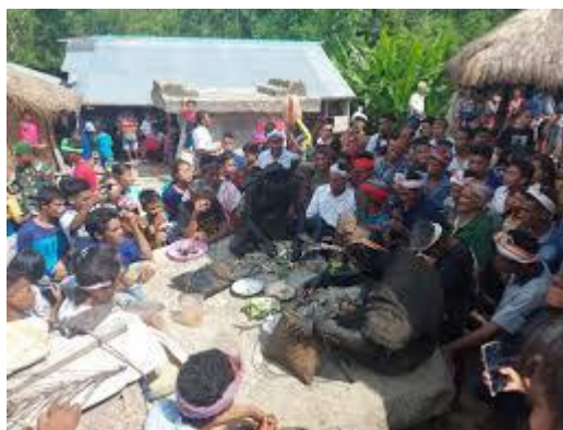
Gambar 1. Upacara Wulla Poddu

berlangsung antara bulan Oktober hingga November. Jenis ritual dilakukan dengan tujuan memohon berkat, sebagai sarana mengucap syukur, bercerita tentang asal-usul nenek moyang dan terdapat pula yang menggambarkan proses penciptaan manusia. Selama melaksanakan ritual Wulla Poddu , masyarakat dilarang melakukan sejumlah pekerjaan harian seperti bekerja di ladang, membuat rumah, tidak boleh merayakan upacara kematian dan acara meriah lainnya. Pada intinya, ritual Wulla Poddu adalah ritual penting yang digunakan oleh masyarakat Marapdatu untuk memberi petunjuk dalam berbagai aspek kehidupan selama periode waktu tertentu. Oleh karena itu, Wulla Poddu menjadi ritual rutin dengan tujuan untuk mendekatkan diri kepada Tuhan Yang Maha Esa.