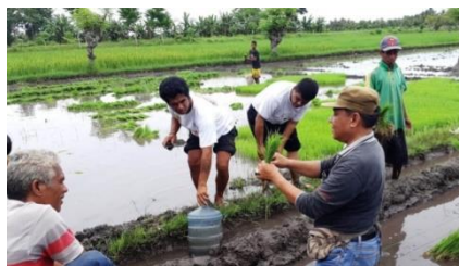
Gambar 6. Mata Pencaharian

Setiap rumah memiliki hewan ternak sendiri, seperti ayam, babi, kerbau, dan kuda. Hewan-hewan ternak umumnya dipelihara dengan tujuan untuk memenuhi keperluan adat. Solihin (2018:14) mengatakan bahwa berbagai upacara adat di Sumba telah mendorong adanya usaha peternakan yang ditujukan untuk memenuhi persediaan hewan dalam upacara pengorbanan. Selain hewan yang biasa dikurbankan untuk keperluan adat, ada pula keluarga yang memiliki ternak kambing dan sapi yang ditujukan sebagai komoditas perdagangan, atau sekadar lauk dalam sebuah perjamuan.