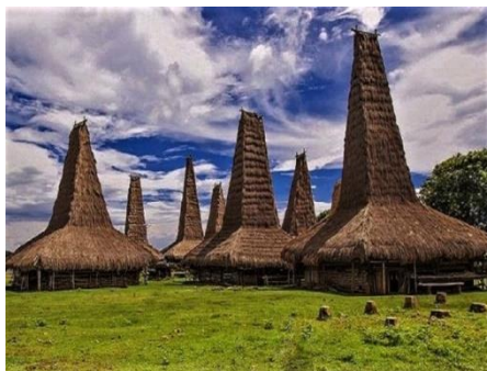
Gambar 7. Rumah Adat Sumba Barat

sedangkan bagian depan dan belakang menjadi area untuk menerima tamu, tempat tidur, dan tempat bagi benda-benda yang melambangkan eksistensi marapu. Bagian rumah tengah merupakan tempat sehari-hari seperti tidur, memasak, dan berbincang-bincang. Bagian tengah terdapat ruang-ruang, seperti bilik-bilik untuk tempat tidur pria, tempat tidur anak perempuan, tempat tidur anak perempuan, dan tempat tidur orang tua, serta ruang depan dan dapur. Bagian pusat rumah, tepat di bawah menara terdapat perapian untuk memasak dan lemari gantung di atasnya. Rumah adat Sumba Barat membentuk rumah panggung dengan atap tinggi yang terlihat seperti menara yang mengakibatkan adanya ruang bawah lantai yang cukup tinggi. Bagian bawah tersebut tidak sakral sehingga biasa digunakan sebagai kandang hewan. Lantai rumah yang tersusun dari buluh-buluh bambu dibiarkan memiliki celah agar air dan sisa makanan dapat langsung dibersihkan dan jatuh ke bawah rumah. Berikut adalah gambar rumah adat Sumba Barat.