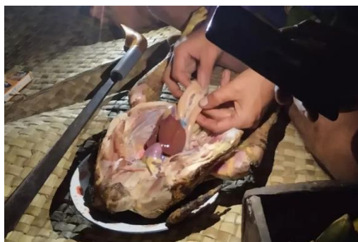
Gambar 3. Ritual Noba Ayam

sebagai hewan yang akan dilihat organ dalamnya. Organ-organ ayam juga dipercaya dapat merefleksikan keadaan seseorang di masa depan. Pada saat seorang Rato mengambil bulu ayam dan membakarnya sampai habis. Mereka percaya bahwa jika tulang tempat bulu-bulu ayam tumbuh lebih banyak berwarna hitam, orang yang sedang dibaca nasibnya akan mengalami keburukan. Jika tulang bulu berwarna putih maka akan lebih banyak hal baik yang datang, hal tersebut juga berlaku pada usus dan organ ayam.