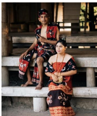
Gambar 4. Pakaian Pernikahan Sumba Barat

Pakaian adat laki-laki Sumba ketika terdapat upacara pernikahan berupa kain tenun yang membelit di perut sampai paha yang disebut hinggi . Ada pula ikat kepala yang disebut dengan Tiara Patang . Serta sebuah parang yang diselipkan di pinggang kiri. Khusus untuk para Rato atau ketua suku, mereka biasanya menambahkan syal senada dengan kain tenun yang mereka pakai. Terdapat hal lain yang dibahas oleh pengarang dalam novel ini, selain makna kebudayaan. Kepercayaan yang dianut masyarakat Sumba yakni Marapu. Di bawah ini merupakan pakaian adat khas Sumba.