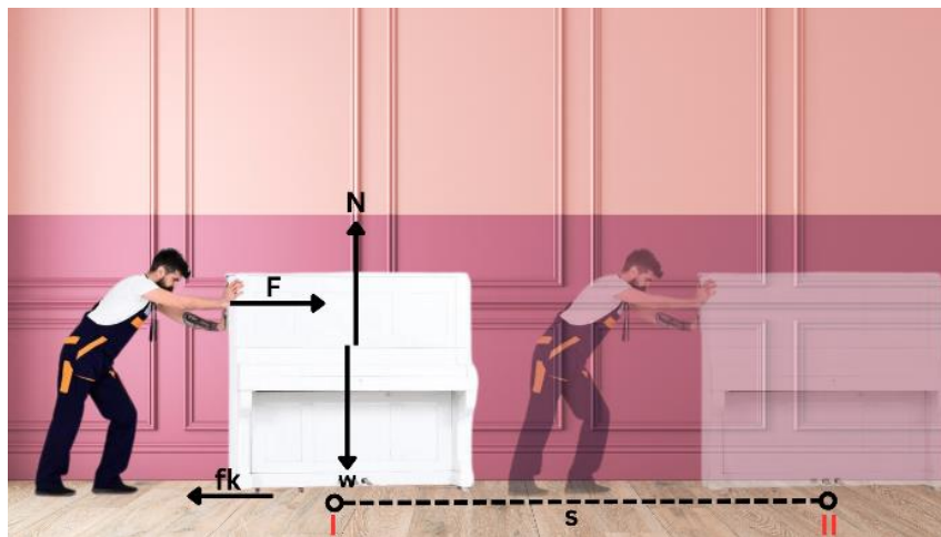
Gambar 2.1 Contoh Real Picture Analysis

Suatu gambar dapat dikatakan sebagai RPA sebagaimana Gambar 2.1, apabila (1) mampu merepresentasikan suatu objek atau fenomena fisika yang diciptakan dengan cara apa pun; (2) dapat difungsikan sebagai media yang dapat memicu siswa agar lebih mudah dalam menelaah atau menganalisis penerapan fisika; (3) gambar dapat merepresentasikan peristiwa yang sesungguhnya terjadi dalam kehidupan sehari – hari; (4) merupakan serangkaian gambar pemodelan objek benda, kejadian atau fenomena yang relatif ada perbedaan dalam hal keadaan, kedudukan, bentuk, maupun kombinasinya yang secara keseluruhan mendeskripsikan suatu tahapan yang berkaitan dan merupakan satu kesatuan yang utuh (Wicaksono dkk., 2019); (5) gambar dilengkapi dengan pengukuran atau gaya – gaya yang mempengaruhi arah gerak benda.