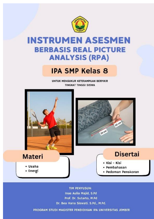
Gambar 4.1 Halaman Depan Instrument Asesmen Berbasis Real Picture Analysis (RPA)

Instrumen Asesmen disusun berdasarkan capaian dan tujuan pembelajaran pada materi Usaha dan Energi untuk memastikan keterkaitan antara butir soal, kompetensi yang akan diukur, serta konteks nyata dalam kehidupan sehari-hari. Indikator butir soal dikembangkan dengan mencantumkan aspek keterampilan berpikir tingkat tinggi yakni level kognitif berdasarkan Taksonomi Bloom revisi antara lain menganalisis (C4), mengevaluasi (C5), dan mencipta (C6). Perancangan butir soal uraian menggunakan stimulus gambar nyata - Real Picture Analysis (RPA) yang dipilih berdasarkan fenomena kontekstual di sekitar siswa, bertujuan untuk mengukur kemampuan analisis, evaluasi dan aplikasi konsep Fisika secara bermakna. Pedoman penskoran disusun secara analitik untuk memberikan pedoman yang jelas dan objektif dalam menilai jawaban siswa. Tampilan umum beserta fitur-fitur yang terdapat dalam paket instrumen asesmen dapat dilihat pada Gambar 4.1, 4.2 dan 4.3.