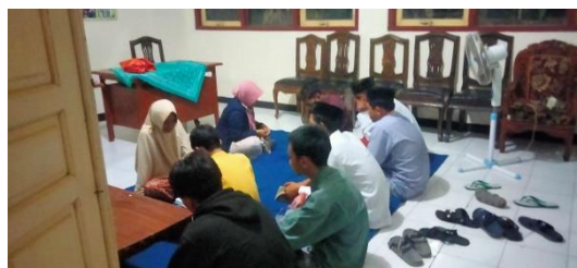
4.3 Bimbingan keagamaan mengaji dilakuka ABH

Seperti hasil wawancara dengan informan Anak yang Berhadapan dengan Hukum (ABH) diajarkan untuk mendalami agama islam seperti mengaji baca Al-Qur’an dan Iqra, sholat, mendalami rukun iman dan rukun islam. Kegiatan ini bertujuan untuk menanamkan norma dan nilai-nilai baik dalam masyarakat agar bisa dijadikan penangkal sikap dan perilaku yang tidak baik kelak nya. Dan juga anak diajarkan berpakaian sesuai ajaran agama sehingga anak terbiasa sampai dewasa.