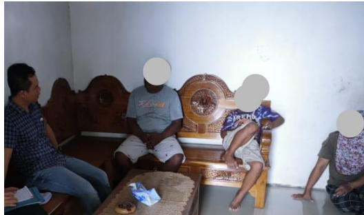
4.7 Proses evaluasi berkala intervensi

mendapatkan wawasan yang lebih mendalam mengenai aspek yang perlu diperbaiki atau diperkuat dalam proses rehabilitasi mereka." AK