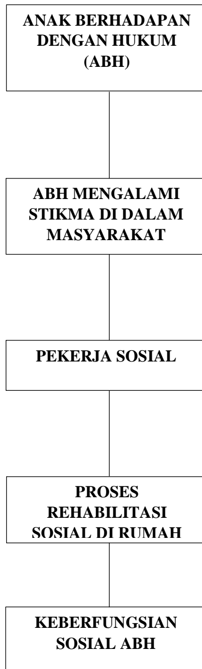
Bagan 2.1 Kerangka Berfikir Peneliti