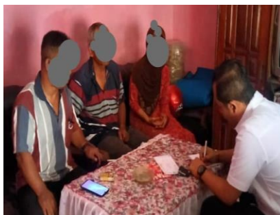
4.6 Proses intervensi berbasis keluarga

Pendampingan keluarga tidak hanya dilakukan secara individu, tetapi juga dalam kelompok. Dalam beberapa situasi, Pekerja Sosial mengorganisir sesi kelompok bagi keluarga-keluarga ABH untuk saling berbagi pengalaman dan mendapatkan dukungan dari sesama orang tua. Ini memberikan kesempatan bagi keluarga untuk merasa tidak sendirian dalam menghadapi tantangan yang mereka hadapi. Melalui sesi ini, mereka dapat memperoleh wawasan baru tentang cara-cara menghadapi anak yang berhadapan dengan hukum, serta saling memberikan motivasi untuk terus mendukung proses pemulihan anak mereka.