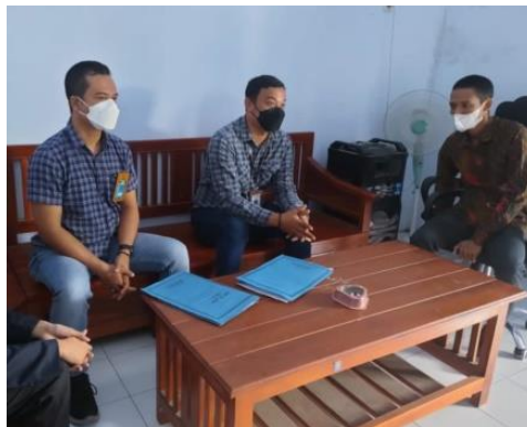
4.9 Pendampingan berkerlanjutan( Dokumentasi Peneliti)

rehabilitasi dapat berlanjut dan berkembang secara berkelanjutan. Pekerja Sosial tidak hanya berhenti setelah penutupan kasus, tetapi juga melibatkan diri dalam memfasilitasi kebutuhan lebih lanjut yang mungkin diperlukan oleh ABH untuk beradaptasi dengan kehidupan sosial dan emosional mereka. Dengan pendekatan yang berkelanjutan, Pekerja Sosial dapat memastikan bahwa ABH memiliki peluang yang cukup untuk terus tumbuh dan menghindari potensi masalah yang dapat menghambat integrasi mereka kembali ke masyarakat.