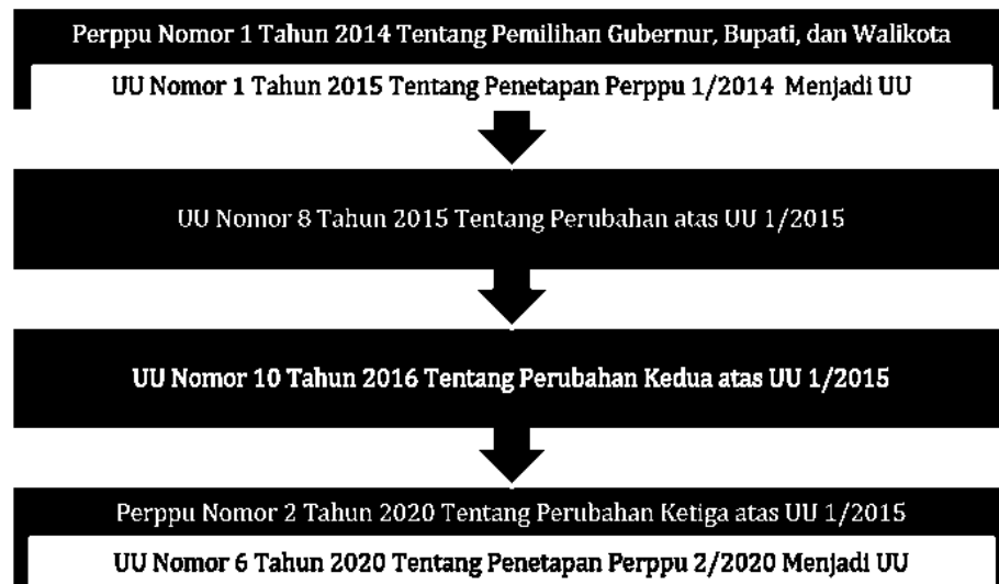
Tabel 4.1 Skema Perubahan Peraturan Pemilu

Beberapa ketentuan undang – undang yang berkenaan langsung dengan pelaksanaan Pilkada serentak termasuk UU No. 22/2014, Perppu No. 1/2014, UU No. 1/2015, juga UU No. 8/2015. Tidak hanya itu, penting juga untuk mencantumkan ketentuan undang - undang yang berkenaan dengan pemerintahan daerah karena Pilkada serempak erat hubungannya dengan implementasi otonomi beserta struktur pemerintahan di tingkat lokal. Di antara peraturan perundang-undangan terkait pemerintahan daerah yang relevan sekarang ini ialah UU No. 23/2014 terkait Pemerintahan Daerah, Perppu No. 2/2014 terkait Perubahan Atas UU No. 23/2014, juga UU No. 9/2015 terkait Perubahan Kedua Atas UU No. 23/2014 terkait Pemerintahan Daerah. Selanjutnya, terjadi perubahan lagi dengan disahkannya UU No.6 Tahun 2020 terkait Penetapan Peraturan Pemerintah Pengganti Undang-Undang No.2 Tahun 2020 terkait Perubahan Ketiga Atas UU No.1 Tahun 2015 terkait Penetapan Peraturan Pemerintah Pengganti Undang-Undang Nomor 1 Tahun 2014 terkait Pemilihan Gubernur, Bupati, dan Walikota.