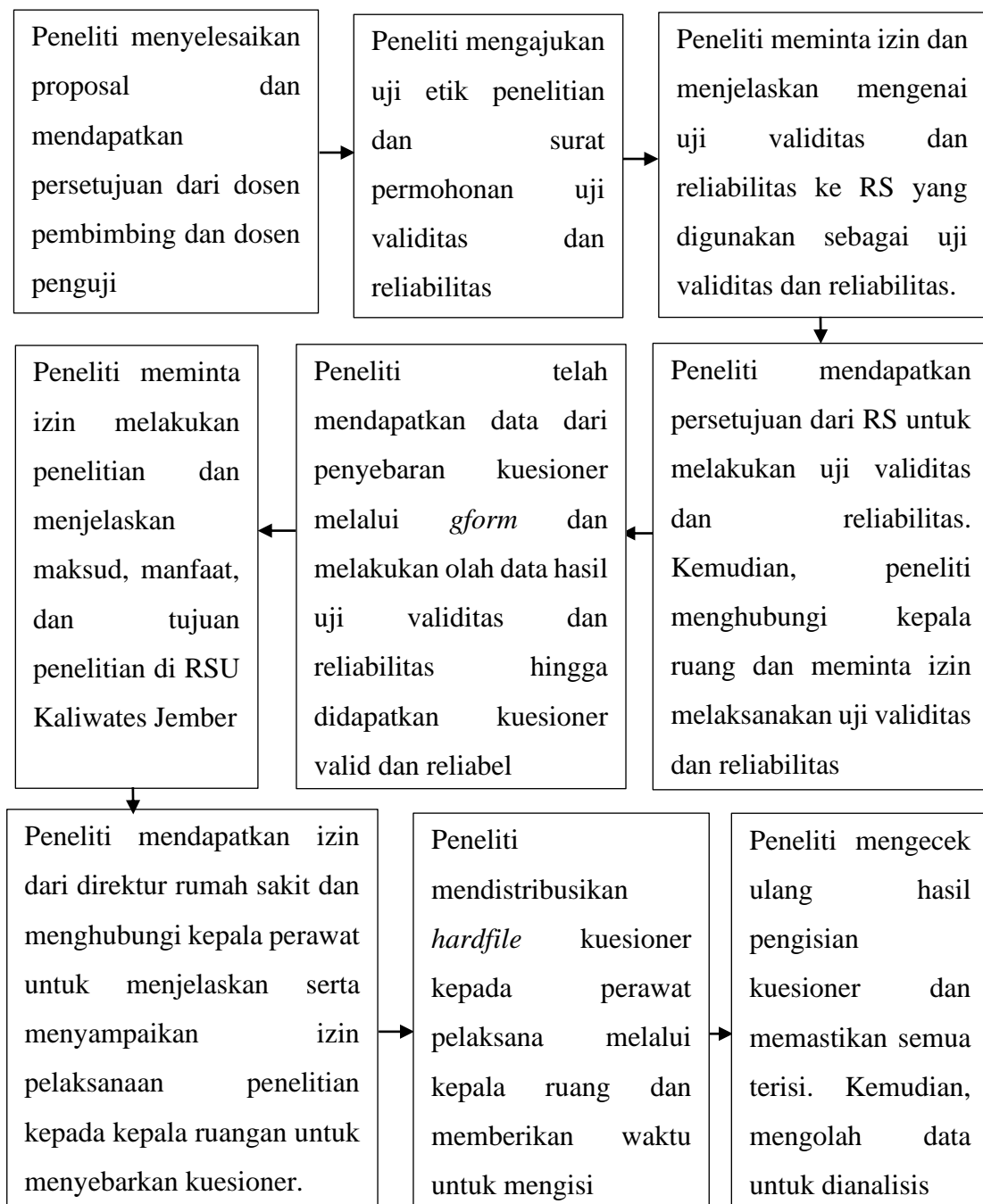
Gambar 3.1 Alur Prosedur Penelitian