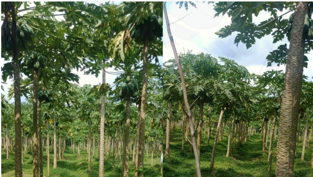
Gambar 4.1 Lahan Pepaya Thailand di Desa Sumber anget.

Pemanenan dilakukan dengan memilih buah yang bagus tingkat kemasakannya buah pepaya dinyatakan dalam bentuk buah muda, buah tua, buah mengkal, buah masak dan buah masak bonyok dari tingkat kemasakan tersebut petani di Desa Sumber Anget memilih buah mengkal yang ditandai dengan mulai menuningnya warna kulit buah, terutama di bagian ujung buah. Daging buah masih keras tetapi bagian dalamnya sudah berubah warna kuning kemerahan.