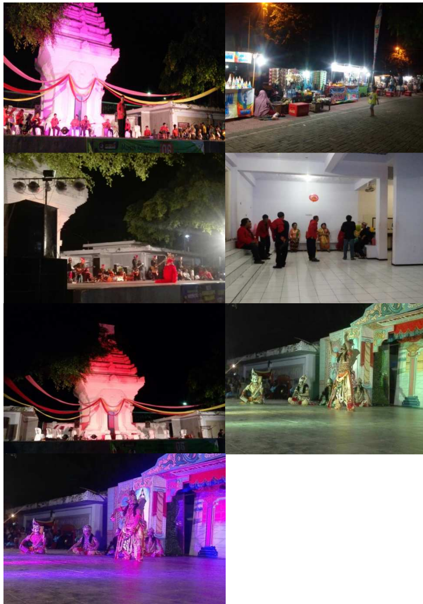
4. Festival Angklung Caruk