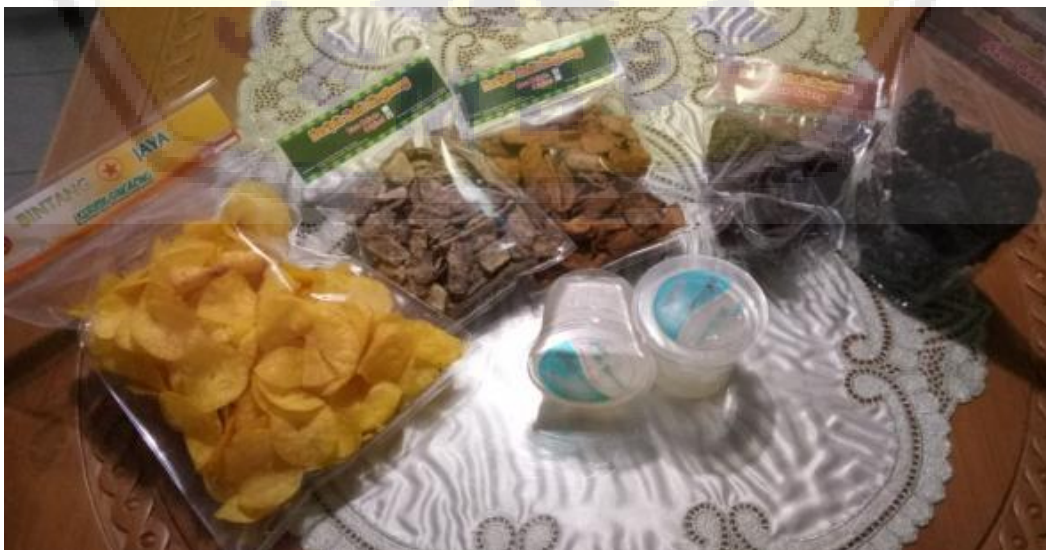
Gambar 1. Hasil Produk IbM

Mitra produsen keripik singkong telah diberikan mesin perajang singkong untuk meningkatkan kualitas dan kuantitas produksinya. Hasil evaluasi dengan menggunakan mesin ini, keripik singkong yang dihasilkan lebih bagus bentuk dan warnanya serta rasanya lebih renyah. Selain itu juga dilakukan perubahan kemasan produk dan pengurusan izin PIRT, sehingga produk lebih menarik dan memiliki nilai jual yang lebih tinggi.