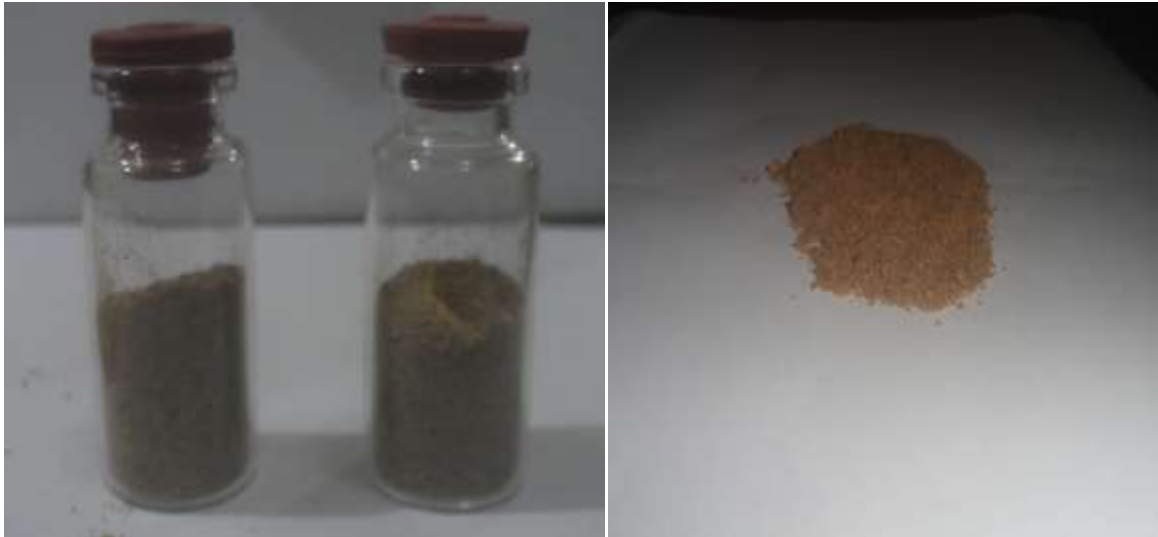
Gambar 1. Granula yang mengandung senyawa toksil sebagai Bioinsektisida baru

Hasil.Pengujian toksisitas ssenyawa aktif terhadap mortalitas larva Aedes aegypti L