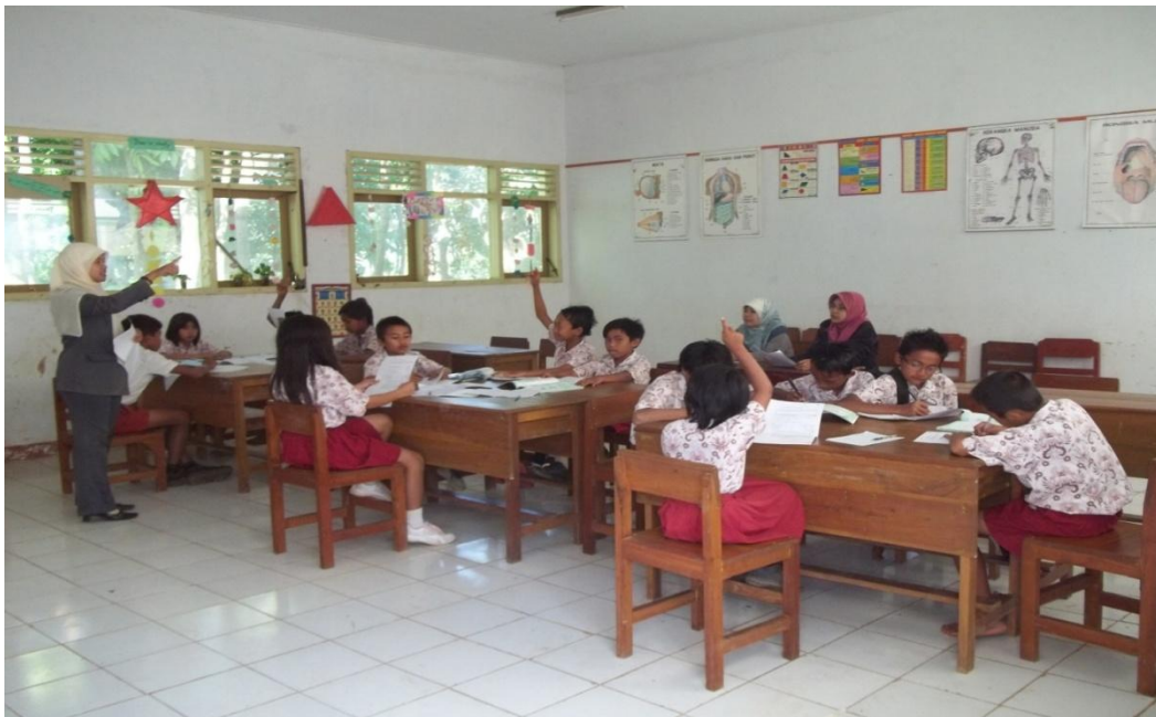
Gambar 4. Kegiatan siswa menukarkan dan mengoreksi bersama hasil pekerjaannya dengan teman untuk menemukan kesalahan dan kekurangan secara langsung