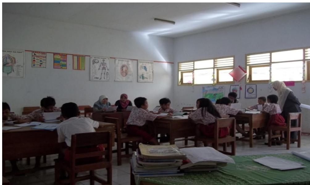
Gambar 2. Kegiatan Siswa berdiskusi dengan kelompok untuk menemukan unsur-unsur surat pribadi