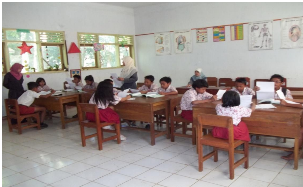
Gambar 1. Kegiatan guru membagikan dan menunjukkan contoh surat pribadi pada siswa