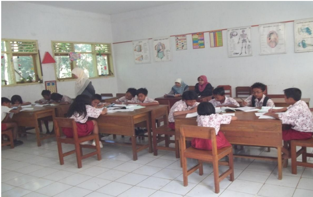
Gambar 3. Kegiatan guru membimbing siswa dalam menulis surat pribadi