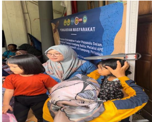
Gambar 3. Tim bersama kader posyandu melakukan DDTKA pada anak

Gambar 3 menunjukkan demonstrasi DDTKA (Deteksi Dini Tumbuh Kembang Balita), kader dengan di dampingi tim melakukan penimbangan berat badan dan pengukuran tinggi badan. Setelah itu dilanjutkan dengan pemeriksaan perkembangan dengan menggunakan kuesioner KPSP (Kuesioner Pra Skreining Perkembangan).