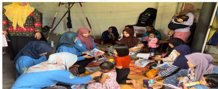
Gambar 2. Menunjukkan pemberian edukasi oleh tim pengabdian

Tabel 1 menunjukkan bahwa sebagian besar responden yang sudah di berikan edukasi memiliki pengetahuan yang baik tentang pertumbuhan anak dengan benar (87%), perkembangan anak (80%), deteksi dini tumbuh kembang (83%) dan pemberian stimulasi pada anak (80%).