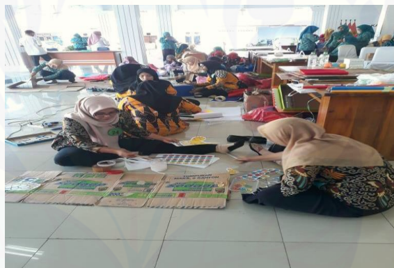
Gambar 4. Tim bersama kader posyandu melakukan DDTKA pada anak

Gambar 3 menunjukkan demonstrasi DDTKA (Deteksi Dini Tumbuh Kembang Balita), kader dengan di dampingi tim melakukan penimbangan berat badan dan pengukuran tinggi badan. Setelah itu dilanjutkan dengan pemeriksaan perkembangan dengan menggunakan kuesioner KPSP (Kuesioner Pra Skreining Perkembangan).