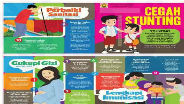
Gambar 2. Leaflet Optimalisasi Air Bersih, Sanitasi dan Nutrisi

Pada pengabdian masyarakat ini jumlah peserta yang hadir 50 orang. Evaluasi kegiatan dilakukan dengan memberikan pertanyaan melalui kuesioner tentang air bersih, sanitasi dan nutrisi yang berhubungan dengan stunting .