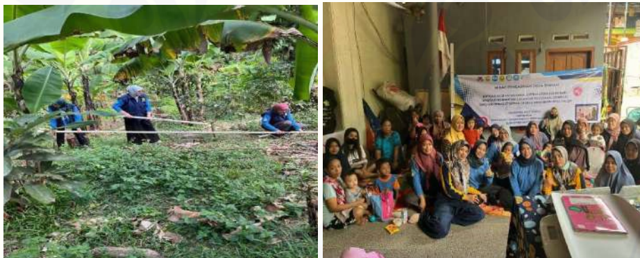
Gambar 3. Kegiatan Mitigasi Kesehatan Anak

Stunting dapat dihindari jika ibu melakukan tindakan yang menjaga kesehatan anak dan gizi yang cukup selama 1000 hari pertama kehidupan. PAMDES salah satu inisiatif unggulan pemerintah untuk memperbaiki sanitasi masyarakat. Hasil pre-test menunjukkan bahwa 51% responden mengetahui nutrisi apa saja yang dibutuhkan, dan hasil post-test menunjukkan bahwa 100% responden mengetahui nutrisi apa saja yang dibutuhkan dan apa saja yang perlu diberikan. Hal ini mengharuskan makan berbagai macam makanan. ASI, makanan yang berasal dari tumbuhan (buah-buahan, sayur-sayuran, dan makanan pokok), makanan yang berasal dari hewan (susu, telur, ikan, dan daging), dan ragam makanan dari masing-masing kelompok yang wajib dikonsumsi (De Pee & Bloem, 2009). Kesenjangan nutrisi dimaksudkan apabila variasi makanan diatas tidak dapat diakses, karena terkendala keuangan ataupun tidak tersedianya bahan pangan, bisa digantikan dengan formulasi makanan lain yang diperlukan (Chastre et al., 2007). Hasil pre- dan post-test menunjukkan bahwa penduduk Desa Pager lebih memahami stunting setelah pertemuan ini diadakan. Menurut hasil dari pre-test sebelum pertemuan, sebanyak 66,8% responden tidak tahu apa itu sanitasi yang baik, dan setelah diadakan pertemuan sebanyak 100% responden tahu apa itu sanitasi yang baik. Hasil ini juga berlaku untuk pertanyaan lain.