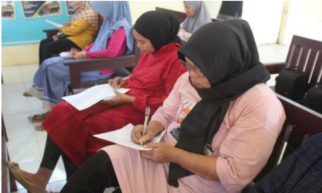
Gambar 3. Pelaksanaan Pretest