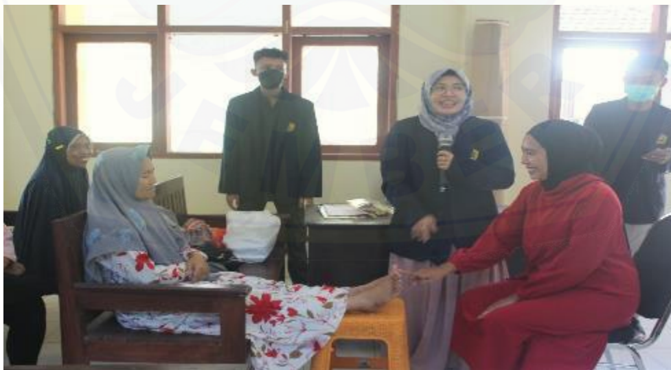
Gambar 2. Demonstrasi, Re-demonstrasi, dan Diskusi

Kader sebagai peserta memberikan antusias yang tinggi terbukti dengan beberapa pertanyaan yang kritis terkait luka kaki diabetes maupun DM secara umum. Diskusi dan tanya jawab adalah salah satu metode yang dapat mengaktifkan peserta dalam proses pembelajaran, terutama pendidikan kesehatan kepada masyarakat. Pernyataan tersebut sesuai dengan penelitian yang dilakukan Maurin & Muhamadi (2018) mengemukakan bahwa metode ceramah dan diskusi mampu meningkatkan aktivitas belajar. Metode ini juga dilakukan saat melakukan edukasi tahap kedua yaitu praktek deteksi luka kaki diabetes, yang bertujuan dengan adanya komunikasi dua arah peserta lebih aktif dan interaktif. Rasa penasaran peserta tertuang dalam pertanyaan-pertanyaan seputar DM dan komplikasi luka diabetes yang ditanyakan pada pemateri.