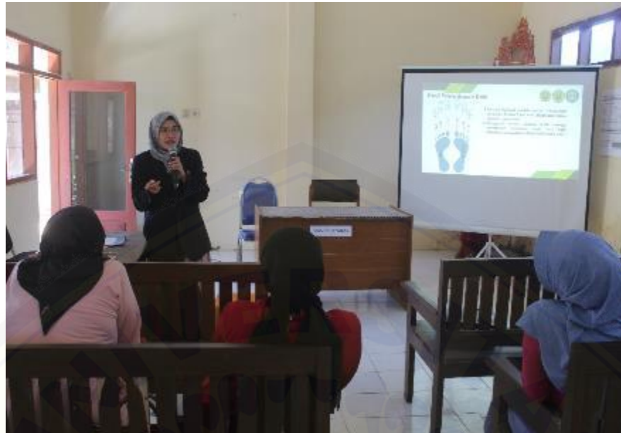
Gambar 1. Pemberian Edukasi