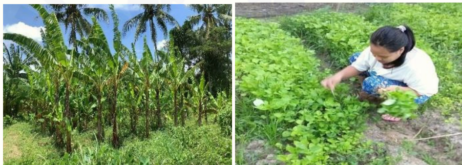
Gambar 2. Potensi Sumber Daya Alam di Desa Tangsil Kulon

Desa Tangsil Kulon memiliki potensi Sumber Daya Alam (SDA) yaitu melimpahnya hasil pertanian dan perkebunan berupa terong, bayam, dan pisang. Melimpahnya hasil pertanian dan perkebunan ini sangat berpotensi untuk dijadikan produk makanan sehat unggulan Desa Tangsil Kulon. Selain potensi SDA nya yang melimpah Desa Tangsil Kulon juga memiliki memiliki fasilitas kesehatan berupa Puskesmas Pembantu (Pustu) dan 7 posyandu dengan 3-4 kader di setiap posnya. Berdasarkan data tersebut terdapat 25 kader posyandu, 5 kader muda, 134 remaja yang nantinya akan diberdayakan untuk membantu dalam pelaksanaan program PELITAKU demi tercapainya Desa Tangsil Kulon yang sehat dan berdaya.