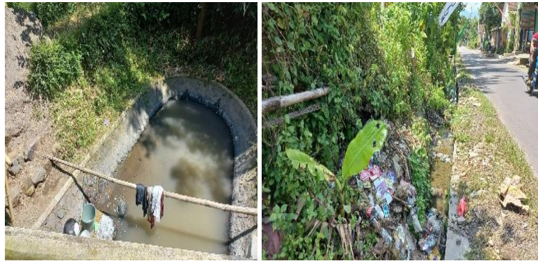
Gambar 3. Tumpukan sampah dan warga yang masih BAB serta mencuci di sungai