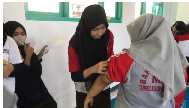
Gambar 17. Pengukuran LiLA pada Rematri MTs/MA Bahrul Ulum

Kegiatan pengukuran LiLA (Lingkar Lengan Atas) dilaksanakan setelah kegiatan sosialisasi gizi yang diadakan pada MTs/MA Bahrul Ulum dengan sasaran remaja putri. Sebelum penerjunan kader untuk pengukuran LiLA dilakukan pelatihan sehingga kader lebih siap dalam melakukan praktik pengukuran LiLA. Kegiatan ini akan dilakukan secara rutin sehingga kader dan tim PPK Ormawa dapat mengetahui perubahan dan perkembangan LiLA dari remaja putri pada MTs/MA Bahrul Ulum. Pencatatan yang dilakukan bertujuan sebagai patokan dalam melakukan intervensi lanjutan apabila pada sosialisasi sebelumnya tidak mendapatkan hasil yang signifikan.