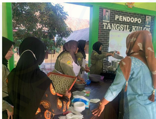
Gambar 14. Demo Memasak