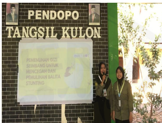
Gambar 11. Penyampaian Materi Gizi Seimbang

Kegiatan sosialisasi gizi dimulai pada jam 15.00 WIB dan berlangsung selama kurang lebih 2 jam. Kegiatan ini diikuti dengan antusias oleh sasaran yang hadir pada kegiatan tersebut. Sasaran yang hadir adalah ibu yang memiliki balita, ibu-ibu kader posyandu, tenaga kesehatan, serta PKK Desa Tangsil Kulon. Beberapa mahasiswa memiliki peran masing-masing, terdapat 2 mahasiswa yang bertugas memberikan materi mengenai pencegahan dan penanganan stunting serta 2 mahasiswa lainnya yang melakukan demonstrasi masak PMT dengan bahan pangan lokal. Terdapat alasan mengenai urutan pelaksanaan sosialisasi yang dimulai dari pemberian materi lalu dilanjutkan dengan demo masak, hal ini bertujuan agar para (sasaran) memiliki gambaran mengenai kekurangan asupan gizi tertentu secara kronis dapat berujung dengan kasus stunting. Demonstrasi masak yang dibawakan yakni proses pembuatan “cilok lele” yang tinggi akan kandungan protein sehingga anak-anak dapat lebih menerima sumber protein tanpa adanya penolakan.