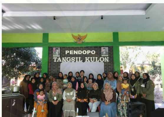
Gambar 12. Dokumentasi Bersama

Sebelum pelaksanaan materi dan demonstrasi masak seluruh peserta, panitia dan tamu undangan, mahasiswa melakukan sesi dokumentasi bersama kader remaja dan tenaga kesehatan pustu untuk nantinya dijadikan dokumentasi terkait sosialisasi gizi: pencegahan dan penanganan stunting pada anak.