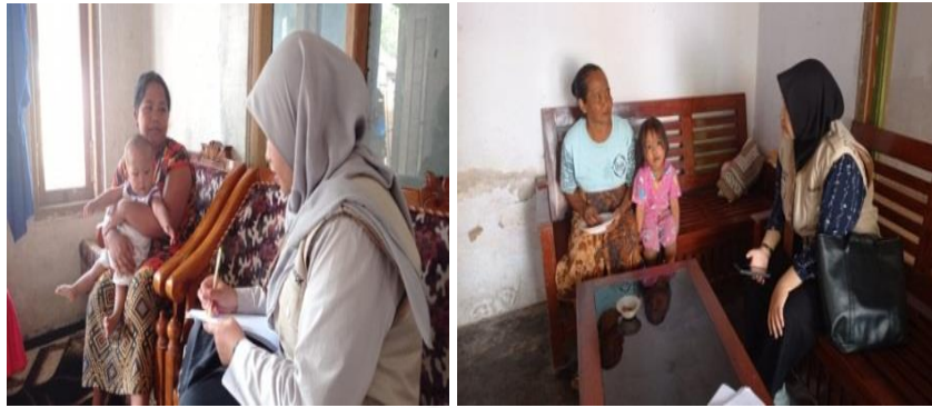
Gambar 1. Kader posyandu dan balita stunting

Desa Tangsil Kulon memiliki potensi Sumber Daya Alam (SDA) yaitu melimpahnya hasil pertanian dan perkebunan berupa terong, bayam, dan pisang. Melimpahnya hasil pertanian dan perkebunan ini sangat berpotensi untuk dijadikan produk makanan sehat unggulan Desa Tangsil Kulon. Selain potensi SDA nya yang melimpah Desa Tangsil Kulon juga memiliki memiliki fasilitas kesehatan berupa Puskesmas Pembantu (Pustu) dan 7 posyandu dengan 3-4 kader di setiap posnya. Berdasarkan data tersebut terdapat 25 kader posyandu, 5 kader muda, 134 remaja yang nantinya akan diberdayakan untuk membantu dalam pelaksanaan program PELITAKU demi tercapainya Desa Tangsil Kulon yang sehat dan berdaya.