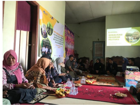
Gambar 6. Sosialisasi program PELITAKU

Sebelum tahapan pengenalan PPK Ormawa, tim PPK Ormawa Himagizi telah melakukan observasi dan analisis situasi pada desa Tangsil Kulon yang memiliki output penyusunan konsep program yang akan dibawakan tim PPK Ormawa bagi desa Tangsil Kulon. Kegiatan pengenalan tim PPK Ormawa kepada masyarakat desa Tangsil Kulon bertujuan agar tim PPK Ormawa Himagizi Universitas Jember dan Masyarakat desa dapat bertukar informasi mengenai masalah yang terjadi secara nyata serta program yang dapat menjadi solusi dari permasalahan masyarakat di desa Tangsil Kulon. Program yang dibawakan oleh tim PPK Ormawa akan menaungi beberapa masalah yang telah dihimpun pada saat pengenalan tim PPK Ormawa.