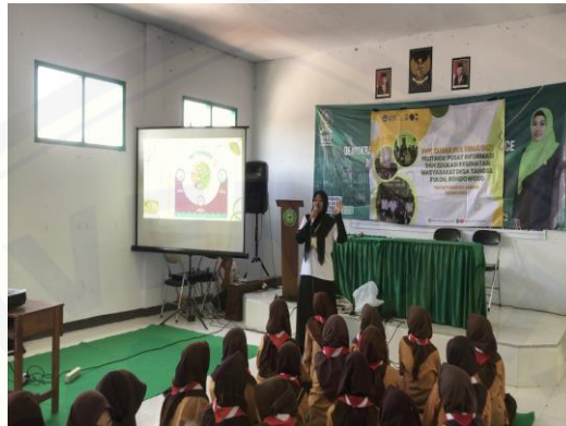
Gambar 15. Penyampaian Materi Gizi Remaja

remaja putri itu penting, karena jika tidak dikawal, setelah siap menjadi ibu akan membahayakan bayi dan remaja itu sendiri. Anemia pada saat kehamilan akan mengakibatkan terjadinya gangguan pada janin, terjadi pendarahan saat persalinan, dan bisa menyebabkan bayi BBLR (Berat Badan Lahir Rendah). Selain anemia, masalah yang perlu diperhatikan adalah KEK (Kekurangan Energi Kronis) pada remaja. Remaja putri sebagai calon ibu di masa depan harus memperhatikan bahwa status gizi mereka baik sehingga tidak akan mengalami kekurangan energi. Jika gizi remaja putri tidak diperbaiki maka akan mengakibatkan ketidaksiapan wanita untuk menghadapi kehamilan dan menyebabkan tingginya prevalensi stunting. Hal ini sejalan dengan penelitian yang dilakukan oleh Waytherlis Aprianiani et al., bahwa ada hubungan riwayat KEK dengan kejadian stunting pada balita, dengan kategori hubungan sedang (Waytherlis Aprianiani et al.)