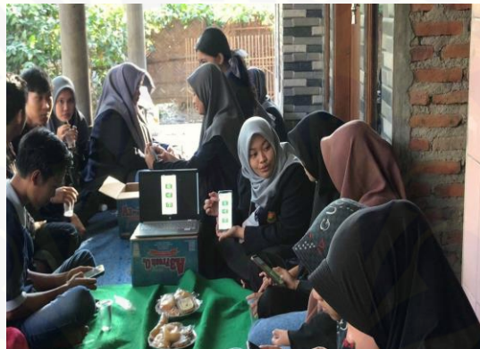
Gambar 10. Pendampingan penggunaan aplikasi PELITAKU PINTAR

Pengenalan aplikasi Pelitaku Pintar dilaksanakan dengan dihadiri oleh Kader Muda PELITAKU dan bertempat di rumah salah satu Kader Muda PELITAKU. Dalam kegiatan ini perwakilan mahasiswa dari Tim PPK Ormawa menjadi pemateri dengan menyampaikan definisi, fungsi, dan cara penggunaan dari aplikasi Pelitaku Pintar. Aplikasi Pelitaku Pintar merupakan aplikasi kesehatan yang berisi artikel serta tips kesehatan masyarakat dan lingkungan dengan berbagai topik pilihan untuk sasarannya. Contohnya untuk bayi dan balita, ibu hamil, ibu menyusui, dan remaja. Aplikasi ini juga dapat digunakan kader maupun masyarakat untuk berkonsultasi kepada kepala bidang kesehatan masyarakat dan kesehatan lingkungan terkait masalah yang dihadapinya. Selain itu terdapat jadwal dan pengingat sehingga kader dan masyarakat tahu atas program kerja atau kegiatan terdekat yang akan berlangsung. Fungsi utama dari aplikasi ini adalah untuk meningkatkan pengetahuan masyarakat terkait masalah kesehatan. Sehingga akan meningkatkan kesadaran dan kewaspadaan masyarakat akan masalah kesehatan di sekitarnya.