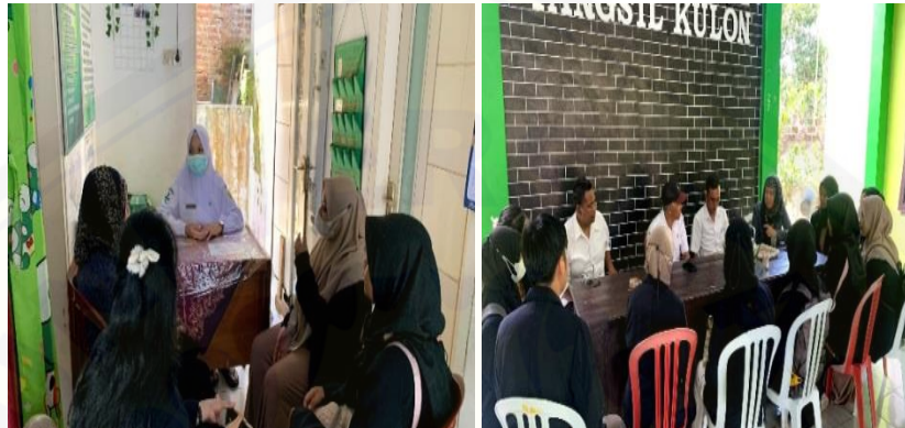
Gambar 4. Wawancara dengan Bidan Desa dan Pemerintah Desa

Berlandaskan potensi dan juga permasalahan yang ada di Desa Tangsil Kulon maka kami mengusulkan kegiatan PELITAKU berbasis aplikasi PELITAKU PINTAR. Kegiatan ini nantinya memiliki 2 pos yaitu pos kesehatan dan pos lingkungan serta aplikasi PELITAKU PINTAR sebagai pusat informasi dan edukasi kesehatan dan lingkungan. Kegiatan PELITAKU mendapatkan dukungan penuh dari pemerintah desa hingga Dinas Kesehatan Bondowoso dengan memberikan sarana dan prasarana untuk Tim PPK Ormawa Himagizi. Dukungan ini sejalan dengan Surat Keputusan Tim Percepatan Penurunan Stunting Bondowoso Tahun 2022 Nomor: 188.45/263/430.4.2/2022, bahwasannya Prodi Gizi Fakultas Kesehatan Masyarakat Universitas Jember merupakan anggota dari tim tersebut.