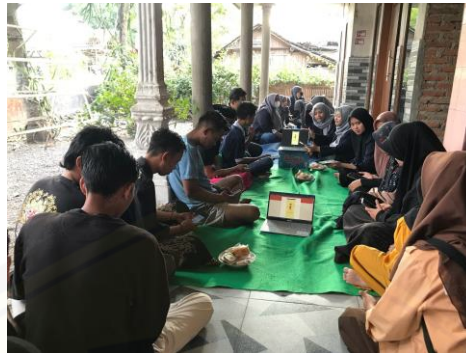
Gambar 9. Sosialisasi aplikasi PELITAKU PINTAR