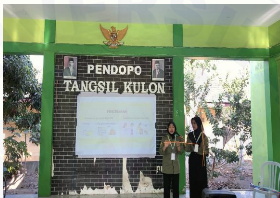
Gambar 13. Emo-demo menggunakan mainan straw building

Kegiatan terakhir dari sosialisasi gizi adalah demonstrasi masak yaitu pembuatan cilok lele sebagai salah satu menu PMT yang memiliki kandungan protein hewani. Selama kegiatan demo masak, semua sasaran terlihat antusias untuk melihat bahkan membantu proses memasak cilok lele. Setelah proses memasak sudah selesai, cilok lele siap disajikan dan dicoba oleh sasaran yang hadir. Semua sasaran yang hadir termasuk balita yang dibawa mencoba cilok lele yang sudah dibuat. Menurut mereka rasa dan tekstur dari cilok lele sudah sesuai dengan kesukaan anak-anak, sehingga bisa menjadi salah satu contoh menu PMT untuk balita.