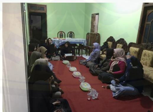
Gambar 8. Sosialisasi tugas kader PELITAKU

Dalam menjalankan program yang telah dicanangkan, tim PPK Ormawa melibatkan masyarakat setempat untuk ikut serta menjalankan program. Bentuk keterlibatan masyarakat dalam program PELITAKU yakni dengan pembentukan kader PELITAKU yang dibagi menjadi 2 kelompok besar yakni, kader kesehatan dan kader kesehatan lingkungan. Kader PELITAKU yang telah terbentuk diberikan pembekalan berupa informasi mengenai kesehatan dan kesehatan lingkungan serta pengenalan aplikasi PELITAKU. Pembekalan ini bertujuan untuk peningkatan kapasitas kader dalam