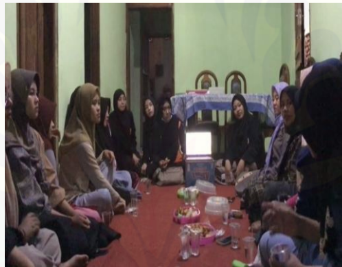
Gambar 7. Pembentukan kader PELITAKU