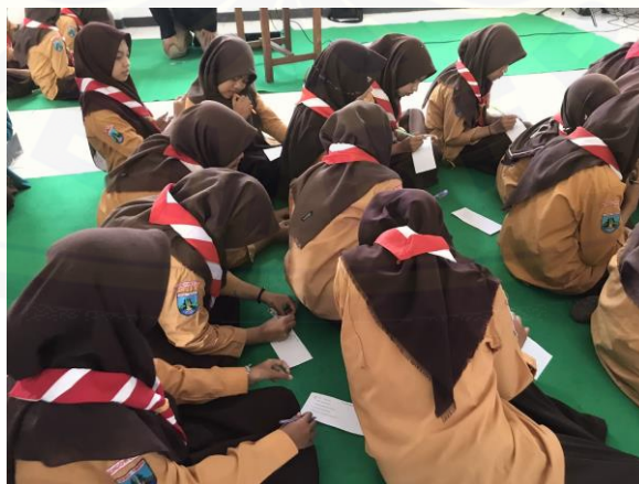
Gambar 16. Pengisian Pre Test dan Post Test

Kegiatan sosialisasi gizi remaja dimulai pukul 08.00 WIB dan berlangsung sekitar 2 jam. Materi yang diberikan meliputi pengertian, gejala, dampak, dan pencegahan dari KEK dan anemia. Semua peserta mengikuti dengan baik serangkaian kegiatan sosialisasi. Saat pemaparan materi semuanya menyimak dengan antusias, hal itu bisa dilihat dari proses tanya jawab saat pemaparan materi. Beberapa peserta aktif menjawab pertanyaan yang disampaikan oleh pemateri. Meskipun beberapa peserta awalnya belum memahami tentang KEK dan anemia. Hal itu bisa dilihat dari perbandingan hasil pretest dan posttest yang diberikan. Terdapat 4 soal yang diberikan saat pretest dan posttest. Ditinjau dari soal pertama tentang pengertian KEK dan anemia, hanya 61% responden yang dapat menjawab dengan benar. Pada soal kedua tentang gejala KEK dan anemia, hanya 38% responden yang menjawab benar dalam pretest yang diberikan. Dalam soal ketiga tentang, hanya 6% responden menjawab benar mengenai dampak KEK dan Anemia. Sedangkan pada soal terakhir atau keempat hanya 70% responden menjawab benar.