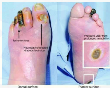
Gambar 3.6. Luka pada ulkus diabetikum

Menurut Perdanakusuma (2018) Ulkus dapat dibagi menjadi dua, yaitu akut dan kronik. Ulkus akut dapat dikategorikan disebabkan oleh dua hal, yaitu abrasi dermal atau ulkus plantar di daerah penopang beban. Ulkus diperiksa untuk drainase, bau, ada/tidak jaringan granulasi, dan jaringan yang