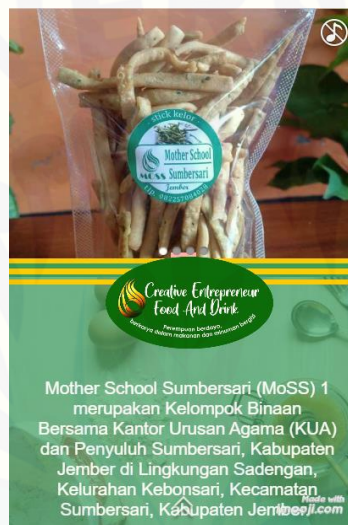
Gambar 5. Halaman Utama Brosur Online

Fitur 'imooji' dapat melakukan kegiatan pemasaran interaktif secara mandiri dengan biaya terjangkau bahkan gratis. Pennerima pesan melalui tautan 'imooji' tidak hanya berupa foto/gambar dan teks, namun juga memberikan fitur lagu dan video masa kini untuk memberikan pengalaman yang lebih berkesan.