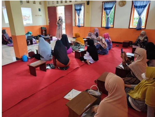
Gambar 4. Pelatihan Pembuatan Brosur online melalui Aplikasi 'imooji'