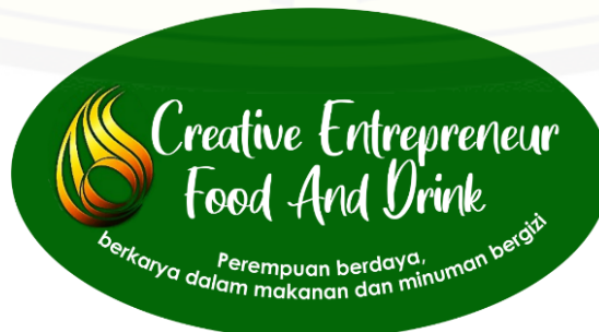
Gambar 3. Branding sebagai Kegiatan Ekstrakurikuler Kewirausahaan

Tim PkM juga melakukan evaluasi bersama terhadap produk-produk yang ada di MOSS 1. Diketahui bahwa label pada produk dengan logo kelompok binaan, perlunya kekonsistenan untuk label pada setiap produk-produk yang ada di MOSS 1. Tim merancang adanya tagline dan identitas bagi kegiatan Kewirausahaan yang bukan hanya sekedar kegiatan ekstrakurikuler kelompok, melainkan unit bisnis (Lihat Gambar 3). Rekomendasi dalam pengembangan selanjutnya adalah menajmen unit bisnis dalam kelompok.