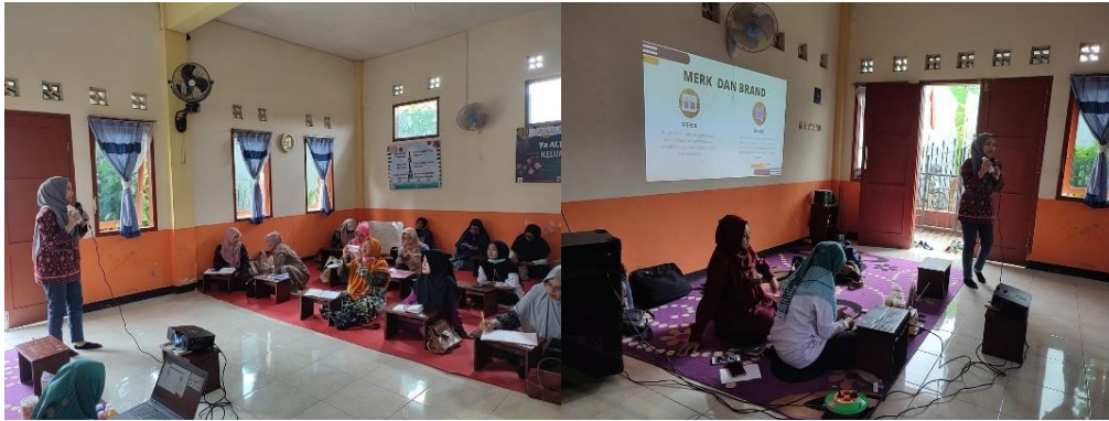
Gambar 1. Penyuluhan dan Diskusi: Materi Branding dan Merek

Evaluasi branding memberikan informasi bahwa keterlekatan kegiatan keagamaan pada MOSS 1 pada media social dengan akun nama personal (pribadi). Hal ini terbukti dari social media devisi kewirausahaan bercampur pada kegiatan-kegiatan utama pada MOSS 1 dan akun personal. Ada pun rekomendasi saat evaluasi bahwa perlunya sosial media yang berbeda pada kegiatan kewirausahaan. Hal ini akan meningkatkan kepercayaan dan posisi penawaran yang baik dalam dunia bisnis.