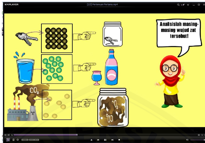
Gambar 1. Karakteristik wujud zat

Gambar 1 menunjukkan adanya tayangan proses yang membedakan karakteristik antara wujud zat padat, cair, dan gas yang menggunakan salah satu contoh masing-masing dari wujud zat tersebut. Contoh dari wujud zat yang diberikan tidak lepas dari kehidupan sehari-hari, sehingga peserta didik lebih mudah dalam memahami contoh wujud zat padat, cair, dan gas. Selain itu, tayangan yang disajikan berupa gambar, animasi, dan suara yang dapat menarik perhatian peserta didik. Sehingga, melalui tayangan yang diberikan ada dalam kehidupan sehari-hari dan disajikan berupa gambar, animasi, dan suara yang menarik, maka peserta didik dapat lebih aktif dalam mengikuti pembelajaran. Peserta didik dapat aktif dalam menjawab apa yang diperintahkan dalam video maupun pertanyaan dari guru, peserta didik lebih aktif dalam memberikan contoh lain yang sesuai dengan karakteristik wujud zat, peserta didik aktif dalam berdiskusi mengenai perintah dalam video yang disajikan. Keaktifan peserta didik dalam pembelajaran dapat membuat peserta didik lebih terlatih dalam menganalisis suatu masalah dengan cara mengkonstruksi sendiri, sehingga peserta didik dapat terlatih dalam menganalisis, mengingat, dan memahami suatu materi lebih baik.