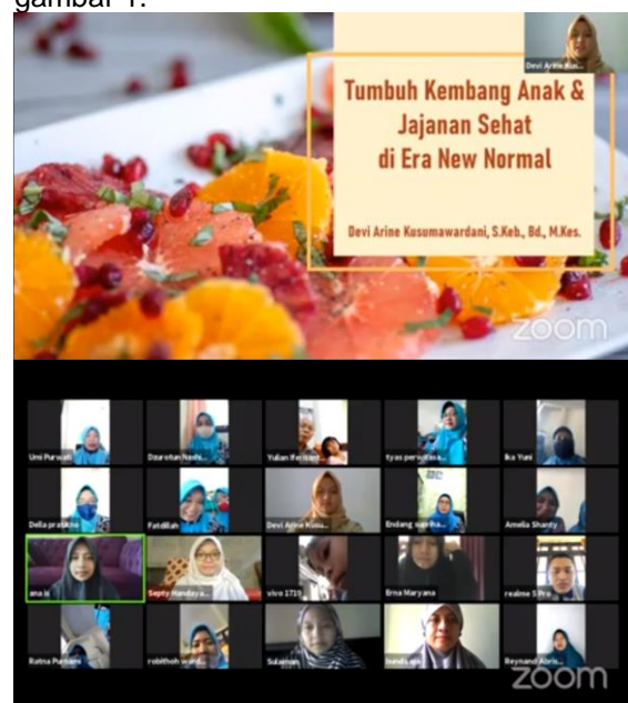
Gambar 1. Sesi edukasi tumbuh kembang anak dan jajanan sehat dengan mitra

yang disampaikan pada sesi edukasi adalah jumlah kasus COVID-19 pada anak, macam-macam jajanan sehat di masa pandemi, dan optimalisasi tumbuh kembang anak selama masa pandemi. Sesi edukasi berlangsung selama kurang lebih 30 menit, setelah sesi edukasi selesai kemudian dilanjutkan dengan sesi diskusi dengan mitra. Selama sesi diskusi, mitra cukup antusias dalam mengajukan pertanyaan. Terdapat 4 pertanyaan yang diajukan yaitu berkaitan tentang macam-macam jajanan sehat untuk anak, kandungan MSG pada jajanan anak, cara memantau tumbuh kembang anak selama masa pandemi, serta cara membuat jajanan sehat pada masa pandemi. Sesi edukasi dapat dilihat pada gambar 1.