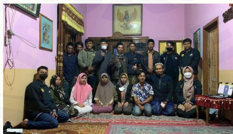
Gambar 3. Sosialisasi Tentang Pemeliharaan Bebek dan Pembuatan Telur Asin.

Minimnya pengetahuan masyarakat khususnya peternak bebek untuk mengembangkan telur asin, serta minat para peternak untuk melakukan inovasi produk. Maka diadakanlah sosialisasi terhadap peternak bebek dan UMKM yang bertema Kolaborasi KKN UNEJ Peduli Semeru dan Multipihak Dorong Eksistensi Telasih Bik Resti (Telur Asin Gurih Bikinan Rekasana Timur).