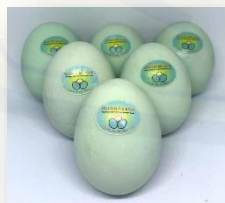
Gambar 6. Produk Telur Asin

Kami juga memberikan desain poster yang sudah jadi kepada mereka agar dapat di gunakan pada saat pemasaran secara offline serta kami juga membantu menyebarkan poster tersebut ke market terdekat seperti catring dan warung makan. Langkah terakhir yaitu apabila para UMKM yang baru berminat sudah melakukan produksi telur asin kami akan membuatkan Google Bisenisku sekaligus mengedukasi cara penggunaannya.