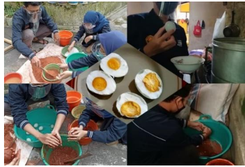
Gambar 2. Proses Pembuatan Telur Asin.

Gambar 2. menunjukkan Mahasiswa KKN 11 UNEJ yang berinisiatif melakukan eksperimen pembuatan Telur Asin Gurih Bikinan Rekesan Timur (Telasih Bik Resti). Eksperimen ini menggunakan 2 metode pembuatan yaitu di kepal dan direndam. Bahan yang digunakan yaitu berupa bata yang sudah dihancurkan, air dan garam yang sudah ditakar. Proses diawali dengan merendam telur selama 2 menit untuk menguji kualitas telur, jika ada yang mengambang artinya telur tidak segar. Kemudian bersihkan dan ampelas telur lalu diamkan hingga kering. Campur batu bata dengan air dan ditambahi garang yang telah ditakar sebelumnya lalu aduk sampai menjadi pasta. Sisihkan beberapa telur untuk metode kepal dengan ketebalan 3 cm dan beberapa telur direndam langsung di dalam pasta. Kedua metode tersebut dipisahkan menggunakan dua buah wadah untuk mengetahui hasil dari kedua metode tersebut. Pengamatan dilakukan selama 3 hari yaitu pada hari ke-5, ke-6, dan ke-7. Telur diambil kemudian dibersihkan lalu dikukus selama 45 menit. Setelah matang, telur di dinginkan dan dilakukan uji organoleptik berupa warna, rasa, dari masing-masing telur.