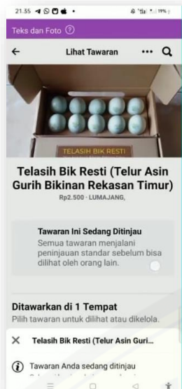
Gambar 5. Digital Marketing di Facebook.