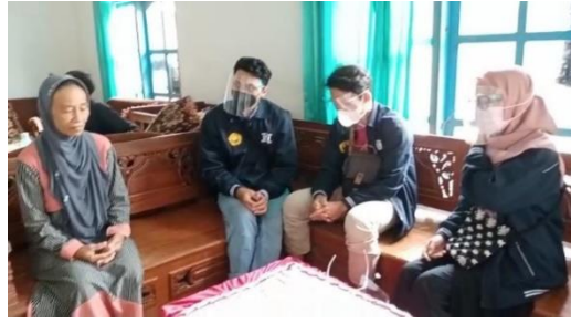
Gambar 1. Penggalian Potensi ke Peternak Bebek.

Berdasarkan hasil survey yang dilakukan pada Gambar 1. masalah dalam pengembangan telur bebek ini adalah proses pemasaran, karena mayoritas peternak bebek yang ada disana kurang memahami proses pemasaran produk. Proses pemasaran dapat diatasi dengan melakukan promosi secara konsisten lewat media offline maupun online , serta pemasaran produk sendiri juga dapat dilakukan lewat BUMDES. Proses pemasaran yang baik dilakukan dengan promosi produk yang menarik, untuk itu perlu dilakukan branding dari suatu produk baik kemasan maupun media promosi (poster, brousur, dan lain-lain).