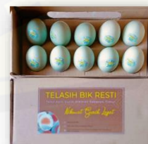
Gambar 7. Telur Asin dalam Kemasan

Perbaikan kualitas produk sangat penting untuk dilakukan untuk meningkatkan kepercayaan konsumen akan produk yang ditawarkan. Peningkatan kualitas produk dapat dilakukan dengan cara melakukan kontrol mutu produk secara berkala dan detail dengan memperhatikan kewananan dan kebersihan dari produk itu sendiri.