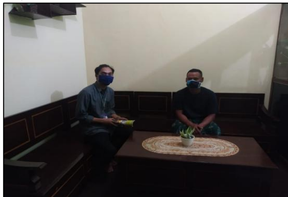
Gambar 1. Diskusi dengan Masyarakat Sasaran

Tahap selanjutnya yaitu pelaksanaan, kegiatan KKN UNEJ Back to Village ini dilaksanakan di Desa Sumberdadap dengan sasaran petani bawang merah dan dilakukan secara individu, pada tahap ini, mahasiswa membuat kegiatan pendampingan ke masyarakat sasaran yang mana diawali dengan pendampingan untuk membuat produk bawang goreng dan setelah itu baru pengemasan, dan dilanjutkan dengan pengenalan online market place Shopee serta cara berjualan online dan menentukan target pasar, baru yang terakhir penjualan dan promosi melalui akun sosial media seperti Facebook dan Instagram. Untuk jelasnya kegiatan selama 45 hari di Desa Sumberdadap bisa dilihat pada gambar dibawah ini: