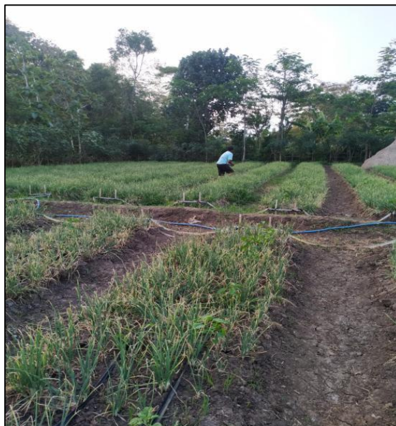
Gambar 2. Pemanenan Bawang Mera