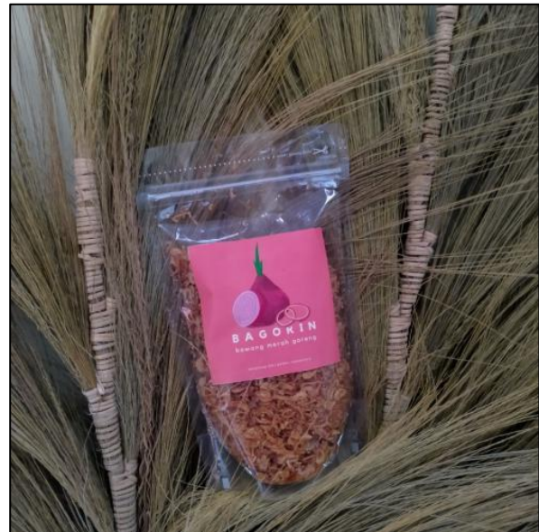
Gambar 3. Pembuatan Logo Produk Bawang Goreng

penjualan secara online masyarakat akan sangat terbantu. Selain itu, penjualan secara online juga sangat cocok dan tepat ketika dilakukan di masa pandemi Covid-19 seperti saat sekarang ini.