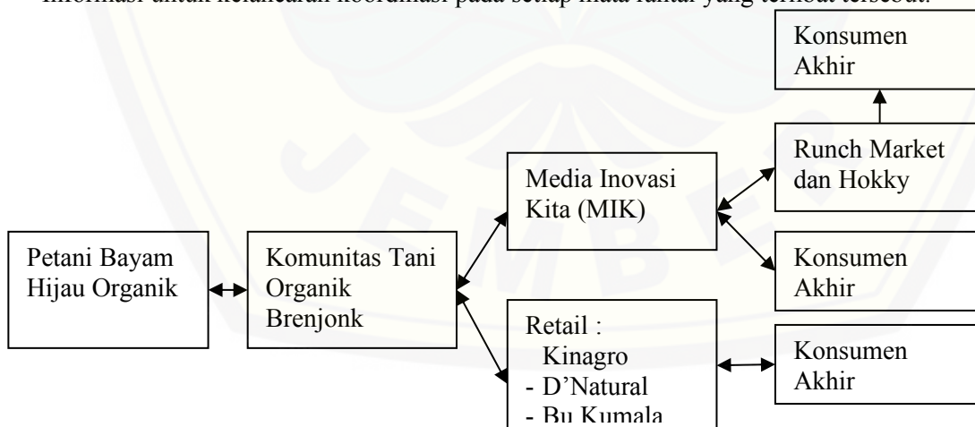
Gambar 3. Aliran Informasi Bayam Hijau Organik