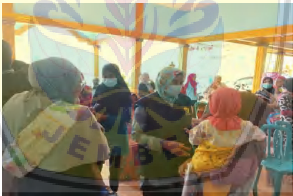
Gambar 4. Pelatihan Pembuatan Menu Gizi Berbasis Lingkungan pada Balita Stunting