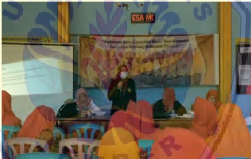
Gambar 2. Musyawarah Pembentukan Kader Kesehatan

Beikut adalah foto-foto kegiatan pengabdian kepada masyarakat di desa Mojoparon Rembang yang didokumentasikan: