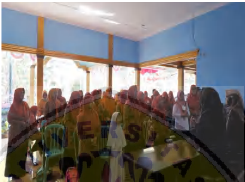
Gambar 3. Pengukuhan Kader Kesehatan