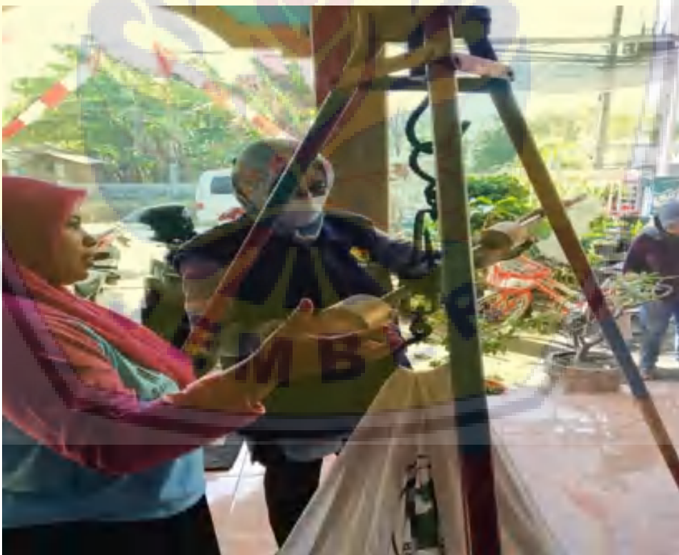
Gambar 7. Pelatihan kader kesehatan desa tentang up grade skill assessment balita stunting