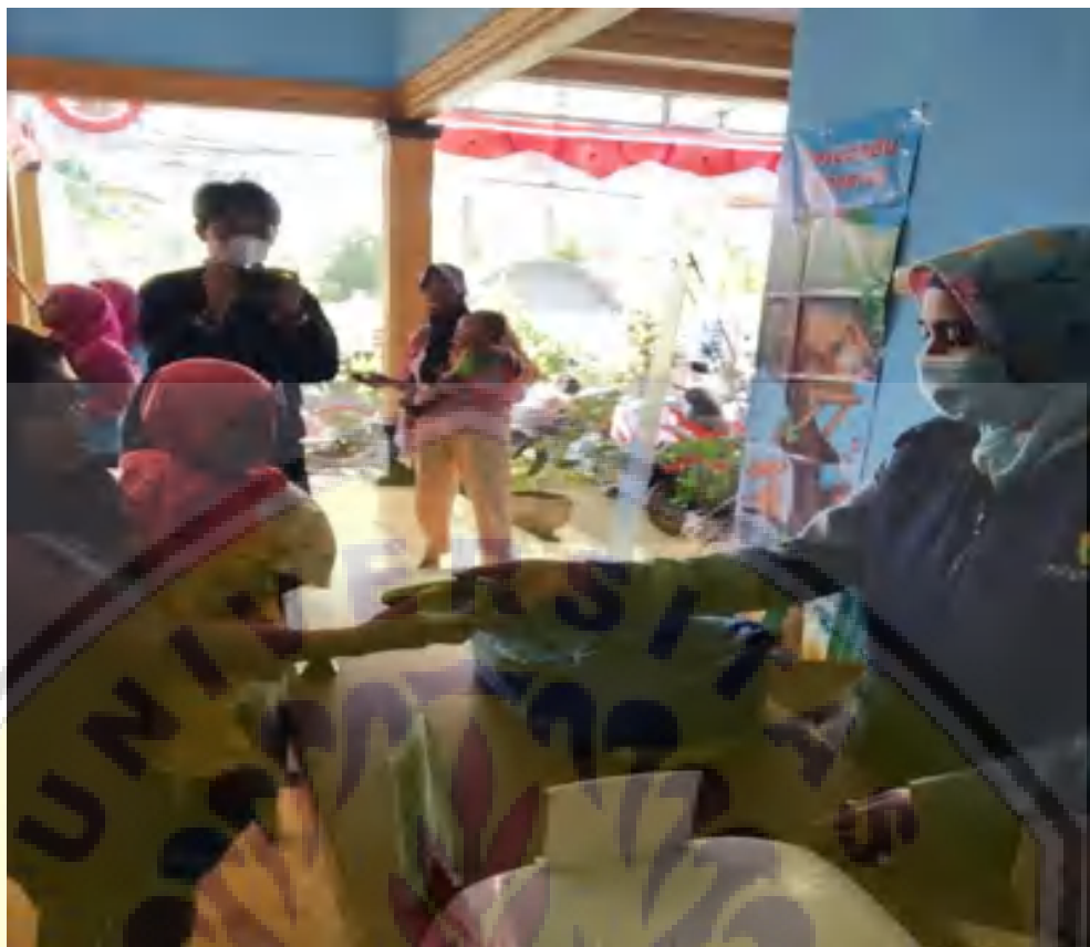
Gambar 5. Pembagian hasil olahan menu gizi pada stunting berbasis lingkungan