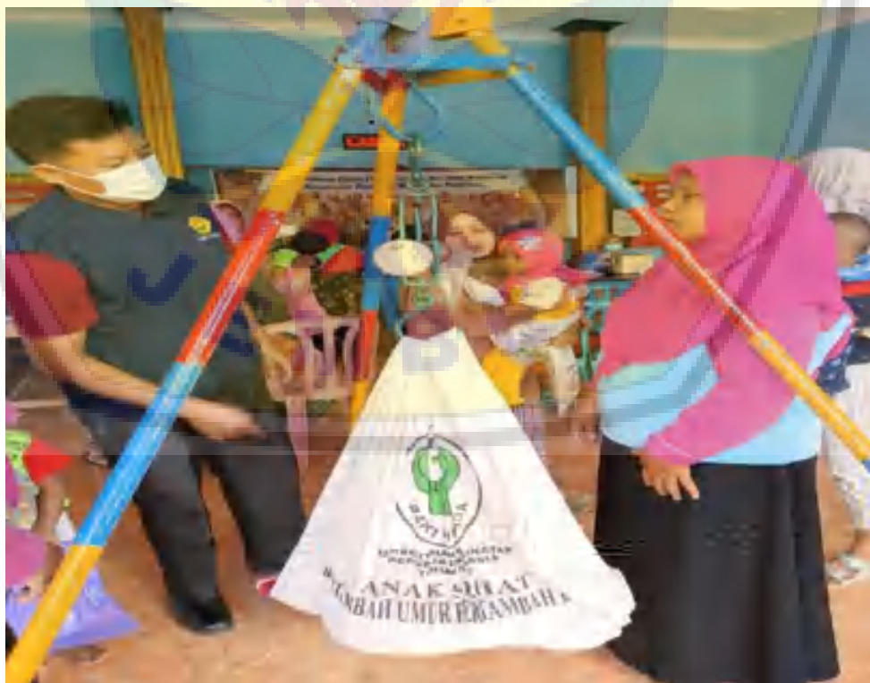
Gambar 6. Pelatihan kader kesehatan desa tentang up grade skill assessment balita stunting