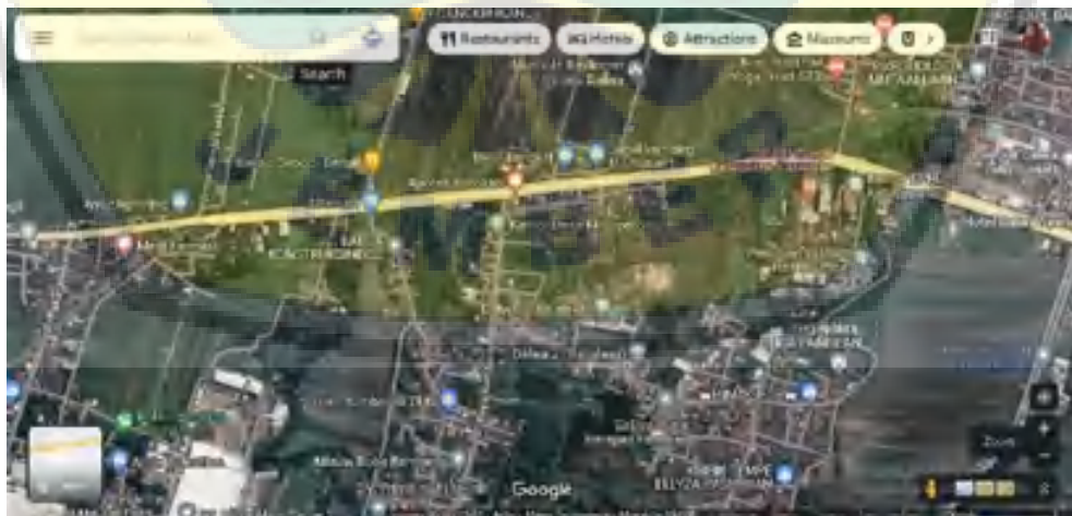
Gambar 1 Peta Lokasi Mitra