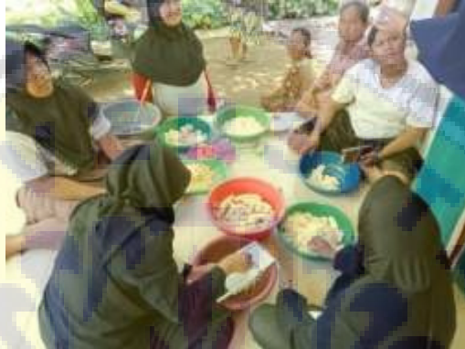
Gambar 1. Sosialisasi dan Pelatihan Pembuatan Muffin Pisang

Di akhir acara sosialisasi dan pelatihan, peserta dapat mencoba muffin pisang yang telah dibuat bersama-sama. Selain itu, tim pengusul juga memberikan catatan resep beserta SOP pembuatan muffin yang dibagikan kepada peserta.