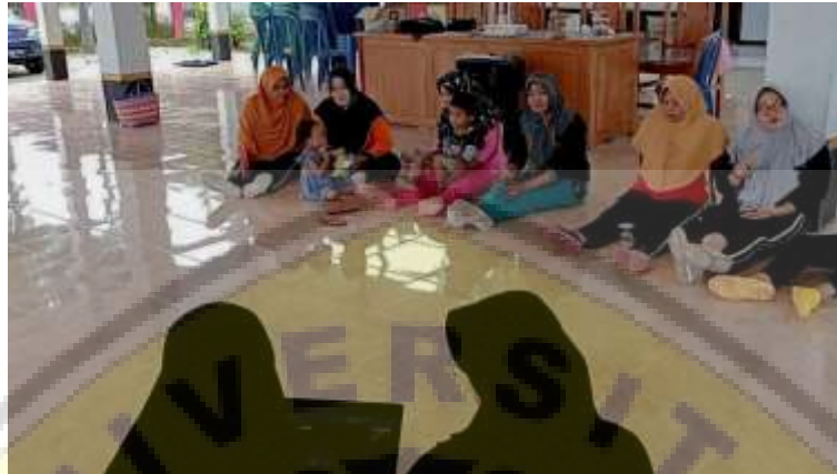
Gambar 2. Sosialisasi Strategi Pemasaran

presentasi yang dijelaskan. Maka dari itu, metode ini dianggap lebih efektif untuk menyampaikan edukasi atau pengetahuan mengenai pemasaran produk.