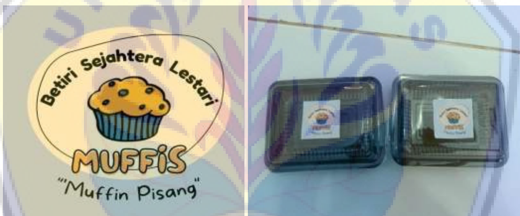
Gambar 3. Packaging dan Logo Produk Muffin Pisang Pokmas BSL

Dalam sosialisasi logo, tim pengusul Program Pengabdian Membangun Desa memberikan pengetahuan terkait pemanfaatan teknologi dalam desain grafis dan pentingnya logo dalam produk. Desain grafis dapat meningkatkan dan memaksimalkan penjualan sebuah produk melalui pembuatan logo. Logo memiliki peranan penting dalam sebuah produk yaitu sebagai identitas (tanda pengenal) produk sebuah kelompok usaha, menjadi simbol pengingat produk bagi konsumen, menarik perhatian pembeli, dan mampu membedakan jenis produk dengan brand lain. Kelompok Betiri Sejahtera Lestari (BSL) dapat memanfaatkan teknologi seperti Handphone sebagai media pembuatan logo produk, dimana Kelompok BSL bisa menggunakan aplikasi canva yang dapat pembuatan logo.