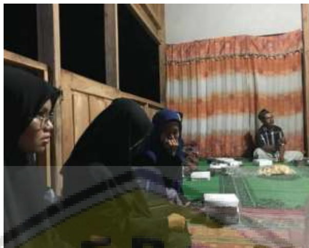
Gambar 6. Sosialisasi Manajemen Usaha